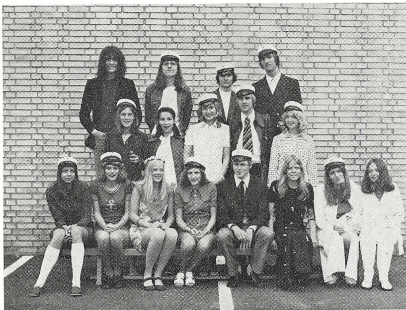
Studenterne fra den sproglige linie b, årgang 1972