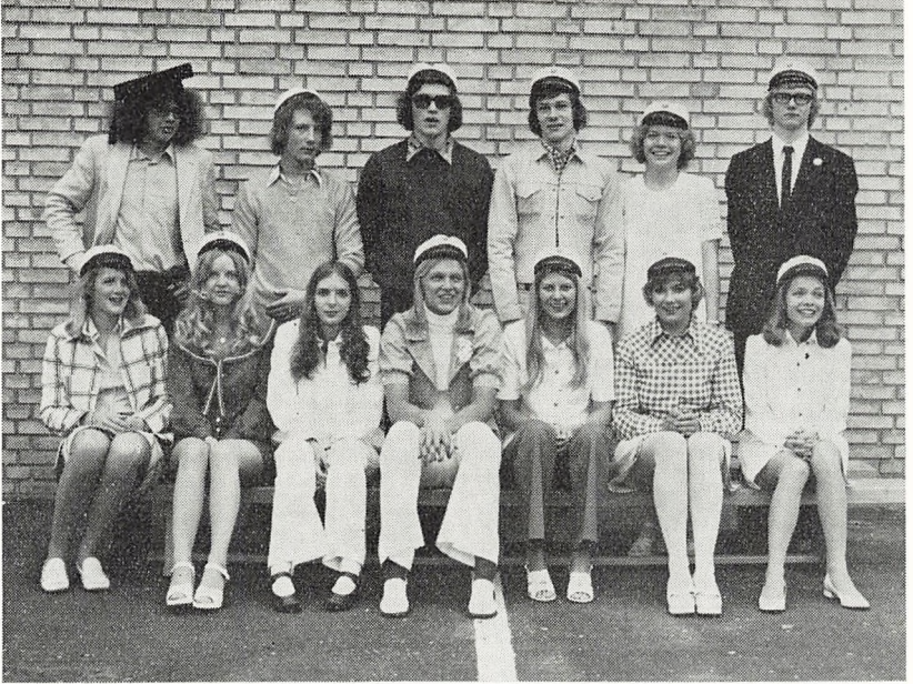
Studenterne fra den sproglige linie a, årgang 1972