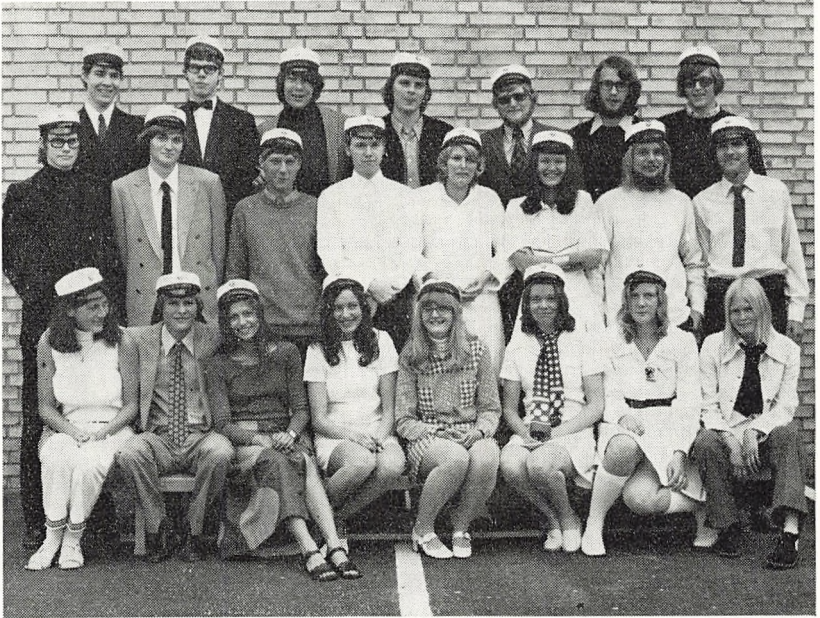
Studenterne fra den matematiske linie x, årgang 1972