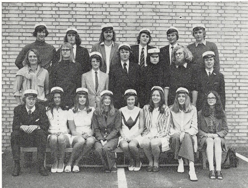
Studenterne fra den matematiske linie y, årgang 1972