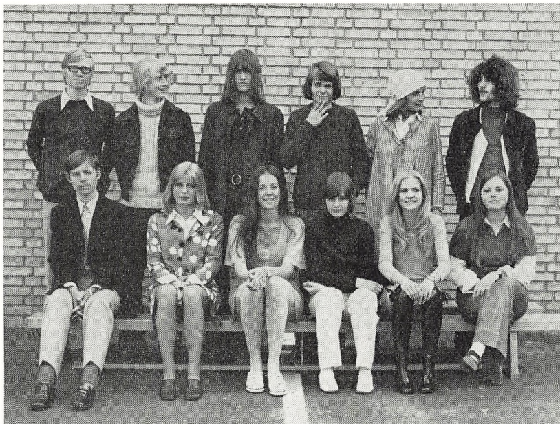
10. klasse, årgang 1972