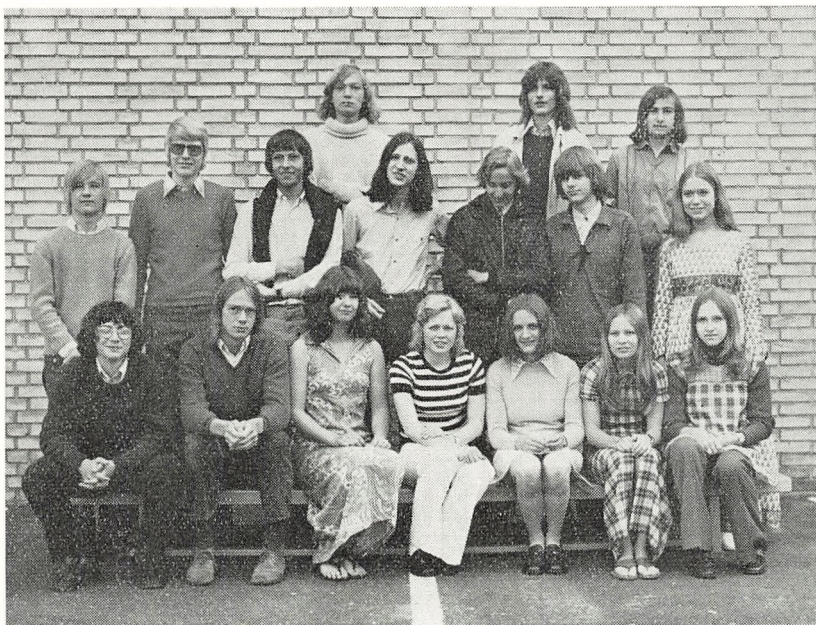
Real a, årgang 1972