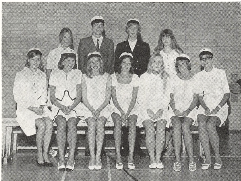
Studenterne fra den sproglige linie a, årgang 1969