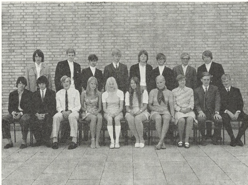
Real b, årgang 1969