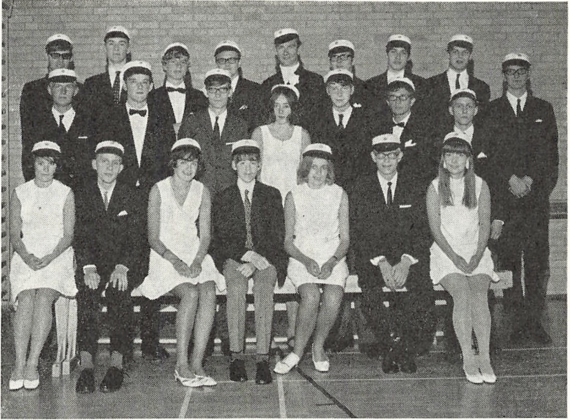
Studenterne fra den matematiske linie y, årgang 1969