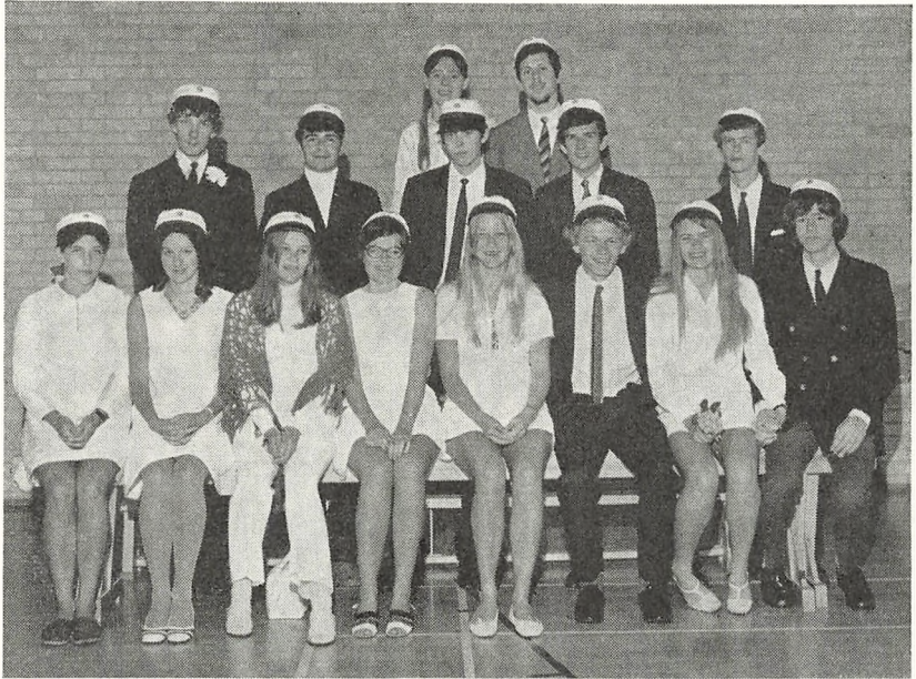
Studenterne fra den sproglige linie b, årgang 1969