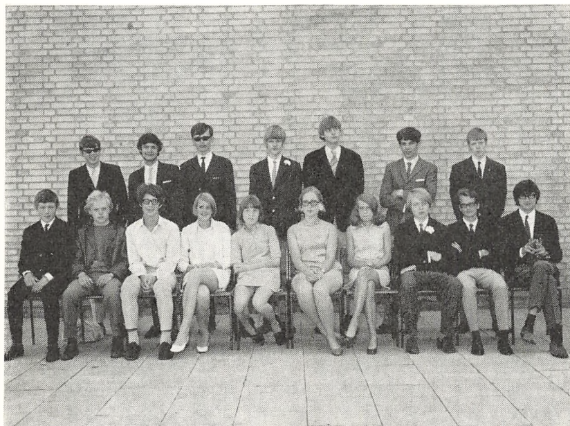
Real a, årgang 1969