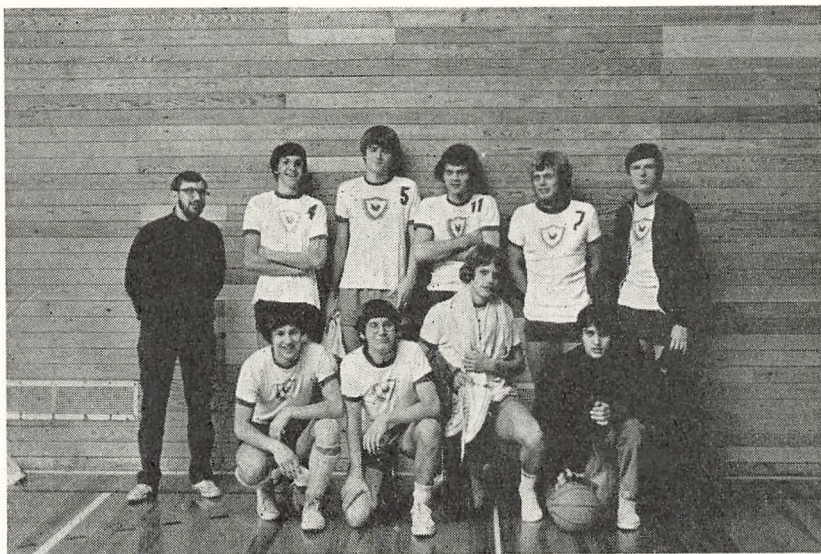
Danmarks mestrene 1969/70

Skolen var arrangør af finalestævnet, hvor Vesthimmerlands Gymnasium