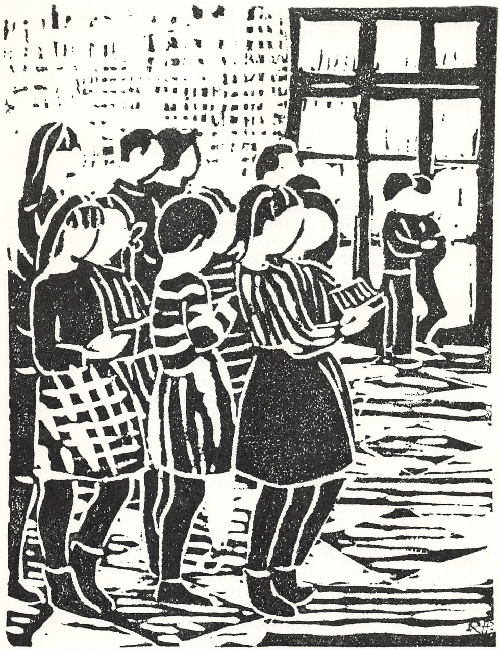
Fra sangen i hallen