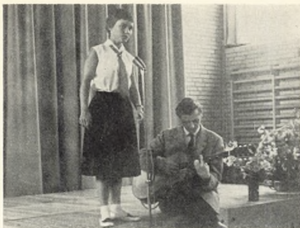
Helle og hendes akkompagnator.