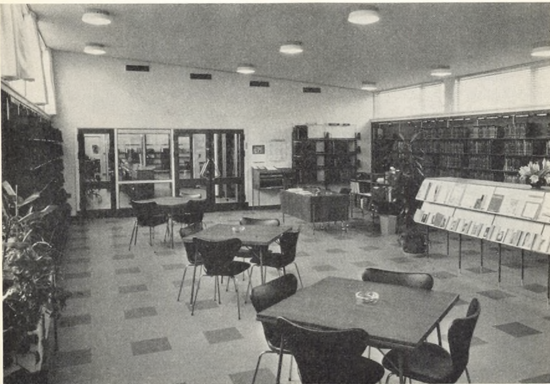
De voksnes udlån og læsesal.

Fra hovedbiblioteket på Kultorvet skaffes fra den ene dag til den anden de bøger, som ikke findes i Kirsebærhaven, f. ex. bøger på fremmede sprog både i skønlitteratur og faglitteratur.