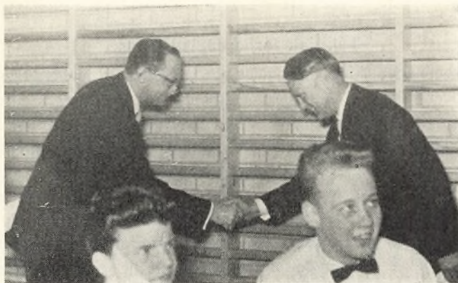
Inspektøren takker vicedirektøren for skolen.