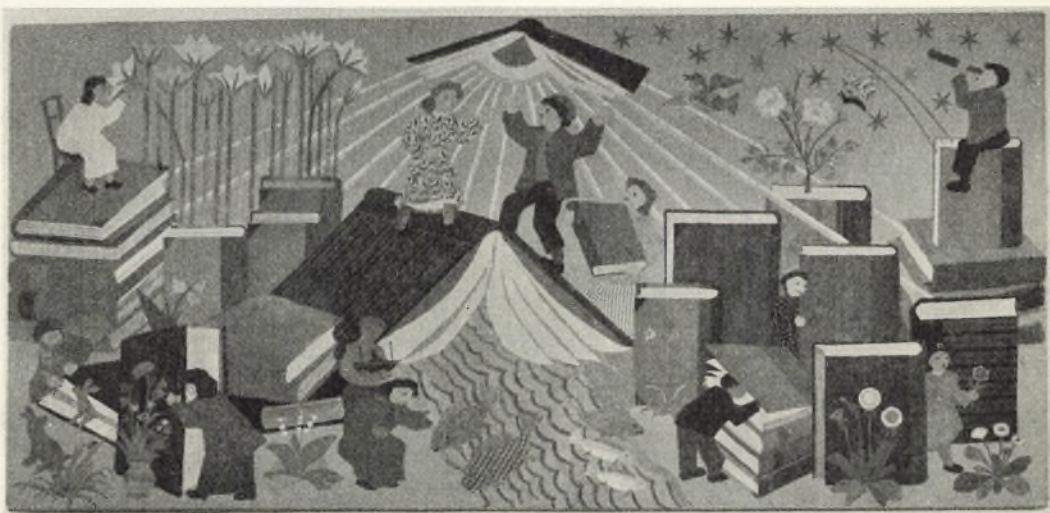
Kludeklip af Dagmar Starcke i børnenes udlån og læsesal.