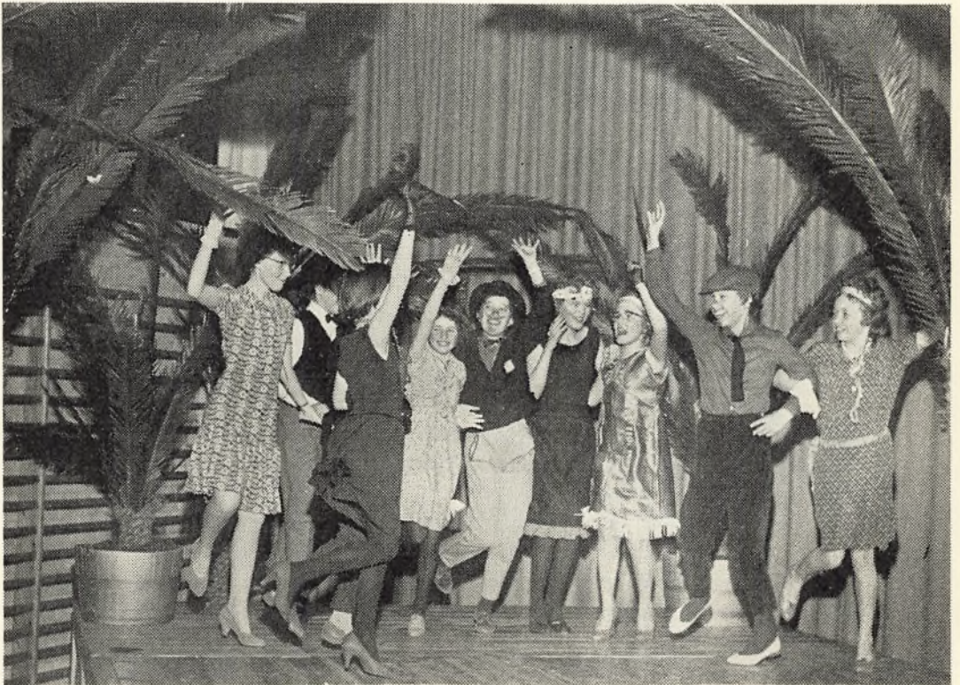
Snap-shot fra basaren.