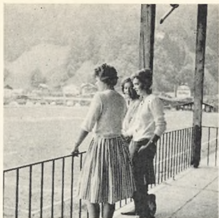
Ved Zell am See juni 1960.

formålsparagraf står: Foreningens formål er at fremme og støtte rejselivet på Kirkebjerg. Foreningen har hidtil forvaltet sin opgave på den måde, at man hver år har kalkuleret en række rejser, som så er blevet tilbudt eleverne. Det har på naturlig måde imødekommet et ønske hos forældre, elever og lærere om at stimulere rejselivet på en måde, som var forsvarlig, udbytterig og relativ billig. Nogle rejser har på dette grundlag kunnet gennemføres, medens andre fik for lille tilslutning. I året 1960 foretog vi rejser til Norge, Bornholm, Østrig og Tyskland. Alle blev gennemført uden uheld, og både elever og lærere vendte hjem med mange gode indtryk. I næste sæson 1961 er følgende rejser fuldt tilmeldt: Norge, Bornholm og Tyskland. Lad det være sagt straks, at ingen ønsker at oppuste et rejsebehov, som ikke er til stede. En erfaring, vi hidtil har høstet, er imidlertid, at et behov er til stede, og mon ikke alle hidtidige deltagere vil godtage, at foreningen har gennemført rejser, som har været et oplivende supplement til skolens daglige arbejde. Af hensyn til kommende rejser skal oplyses, at opsparing til rejserne