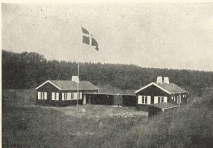
Weekendhytten „Lille Kirkebjerg“.