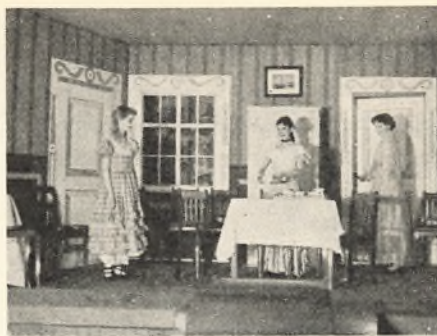
Scene fra „Aprilsnarrene“.

Den 1. maj var der et hold børn på weekendophold under ledelse af forældre. Disse børn havde ikke haft anden mulighed for at komme derud. Styrel-