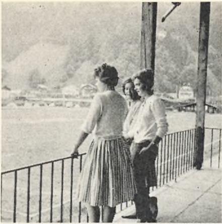
Ved Zell am See juni 1960.

formålsparagraf står: Foreningens formål er at fremme og støtte rejselivet på Kirkebjerg. Foreningen har hidtil forvaltet sin opgave på den måde, at man hver år har kalkuleret en række rejser, som så er blevet tilbudt eleverne. Det har på naturlig måde imødekommet et ønske hos forældre, elever og lærere om at stimulere rejselivet på en måde, som var forsvarlig, udbytterig og relativ billig. Nogle rejser har på dette grundlag kunnet gennemføres, medens andre fik for lille tilslutning. I året 1960 foretog vi rejser til Norge, Bornholm, Østrig og Tyskland. Alle blev gennemført uden uheld, og både elever og lærere vendte hjem med mange gode indtryk. I næste sæson 1961 er følgende rejser fuldt tilmeldt: Norge, Bornholm og Tyskland. Lad det være sagt straks, at ingen ønsker at oppuste et rejsebehov, som ikke er til stede. En erfaring, vi hidtil har høstet, er imidlertid, at et behov er til stede, og mon ikke alle hidtidige deltagere vil godtage, at foreningen har gennemført rejser, som har været et oplivende supplement til skolens daglige arbejde. Af hensyn til kommende rejser skal oplyses, at opsparing til rejserne