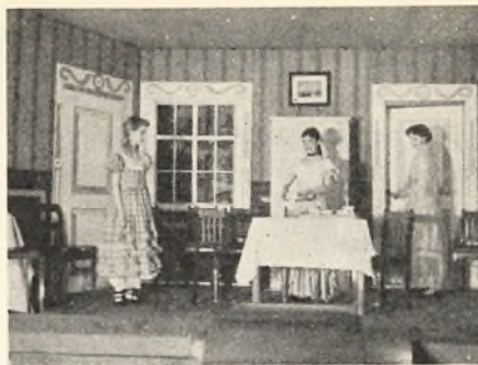
Scene fra „Aprilsnarrene“.

Den 1. maj var der et hold børn på weekendophold under ledelse af forældre. Disse børn havde ikke haft anden mulighed for at komme derud. Styrel-