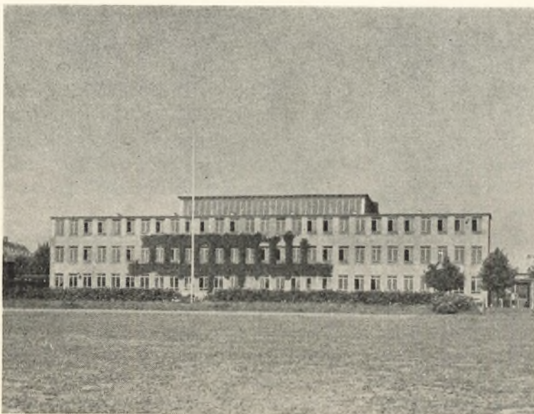
Kirkebjerg skole set fra sportspladsen.

Søndag den 27. februar var forældrene inviteret hen på skolen til en rundvisning i lokalerne. Det blev en interessant tur gennem vor store og