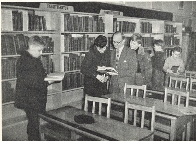
Børnene låner bøger.