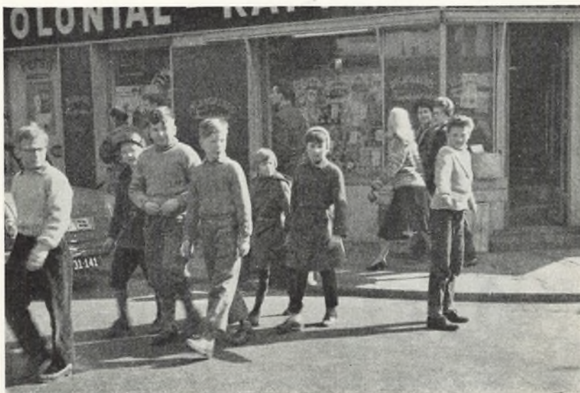
Skolepatruljen i arbejde.