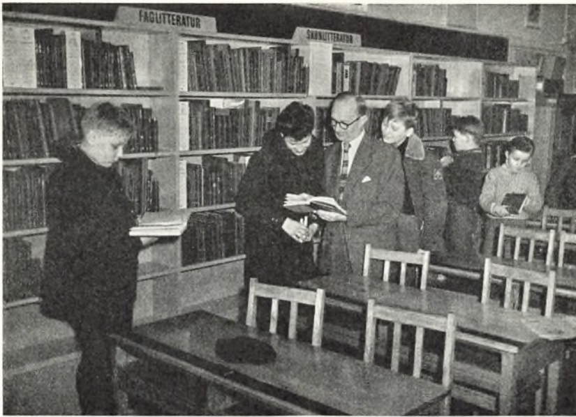
Børnene låner bøger.