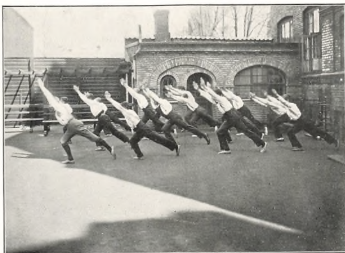
Gymnastik paa Legepladsen.