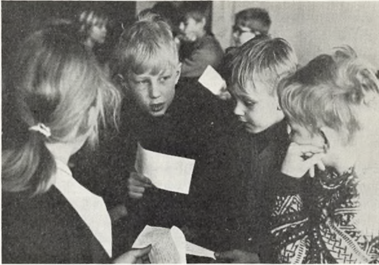
– – drøfter forslag til elevrådet