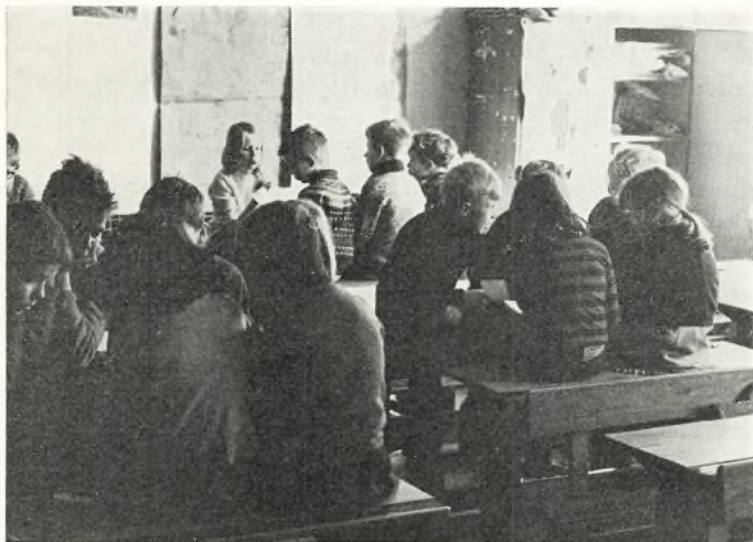
Summegrupper i 3 y --