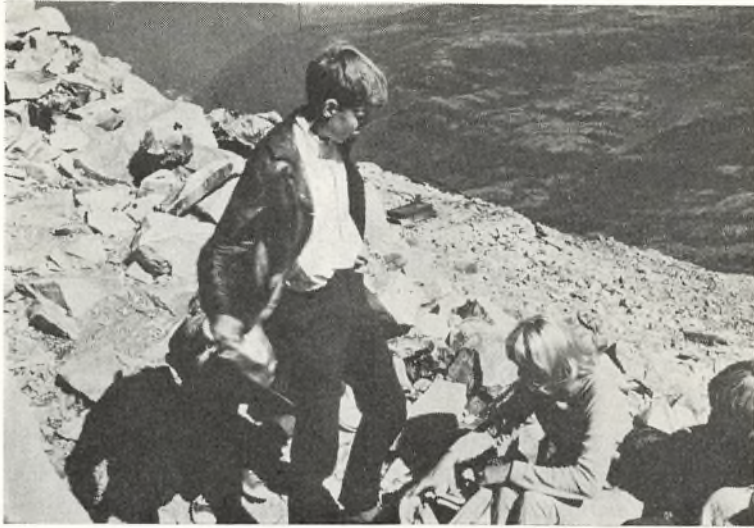
II real bestiger Gaustatoppen