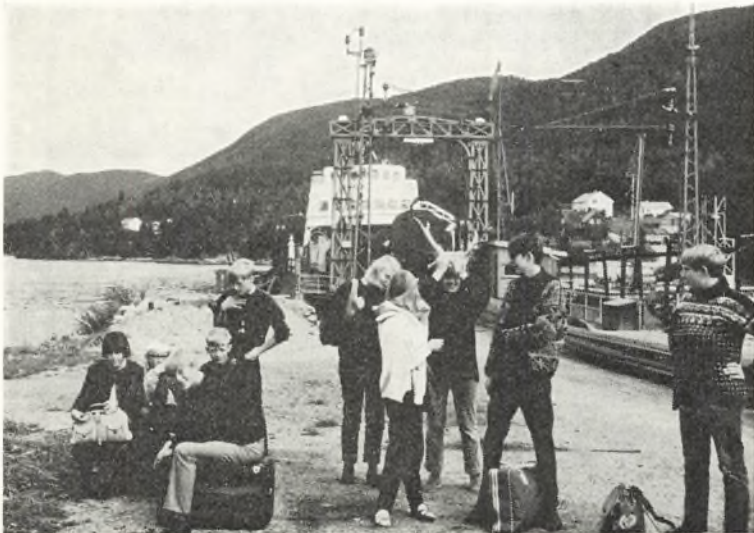
II real, august 1966 – Landgang efter en sejltur på Tinn-søen