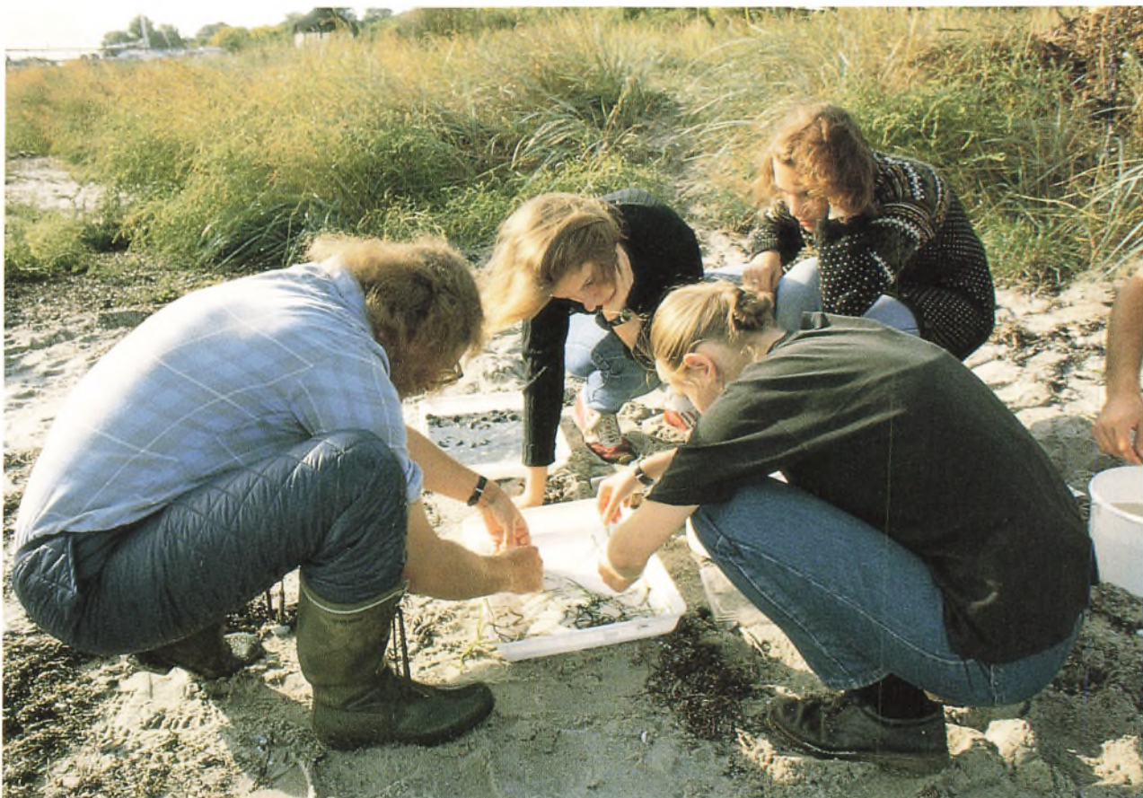
På hytteturene er der både et fagligt og et socialt indhold.