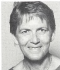
Asta Andersen Kantine