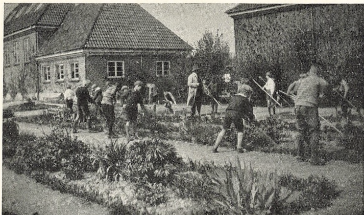
Skolehaverne ved Møllemarkens Skole