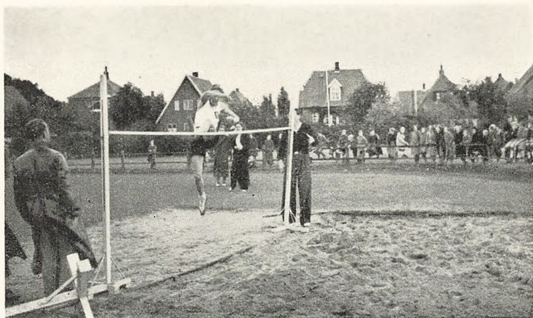
Fra Idrætskampen med Nykøbing Katedralskole 1938