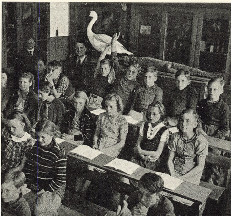
Naturhistorisk Lokale (Eksamensfri Mellemskole)