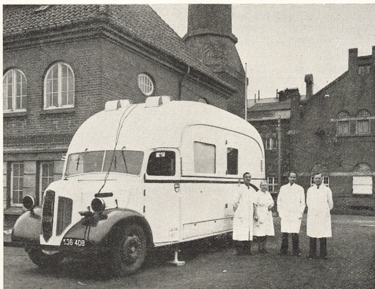
Rontgenvognen i Nakskov