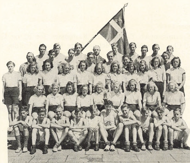
Gymnasiet Idrætshold 1943