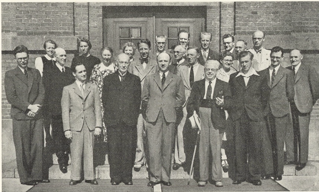
Gymnasiets Lærerkollegium Juni 1943