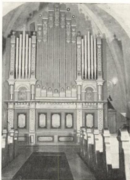
Orglet i Nørre Nisum Kirke

Vi vil til sidst se lidt paa Berettigelsen af den før omtalte Indskrift: Bygt 1833. Omkring 1800 synes Kirken i forsvarlig Stand, men i den følgende Tid med Krig og Pengekrise indtræder Forfaldstiden. Ved Kirkesynet 1812 findes følgende Mangler: Loftet har mange Brud, Gulvet i Koret over Begravelserne har mange Huller, Murene er forfaldne, Prædikestolen og især Kvindestolene er forfaldne. Klokkeakslen brøstfældig, Vinduerne daarlige og med mange sønderslaaede Ruder, Laasen ubrugbar, saa Kirken staar aaben, Alterklæderne forrevne og ikke anstændige. Kirkediget forfaldent, Laager mangler i Stættene. — 1815: Taget overalt utæt. Murene behøver Udspækning og Kalkning. 6 Vinduer brøst-