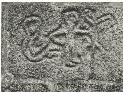
Figuren paa Korgavlen

Rundt om paa Markerne og paa Heden var der nok af store Granitsten, som Bræerne i Istiden havde ført hertil. Dem fik man ved utroligt Slid ført herop paa Bakken. Staar vi en Dag i denne Kirkebygnings- tid heroppe, kan vi maaske høre Raabene, naar man ved et Fællestag skal have en saadan Granitkolos løftet op paa den skrøbelige Vogn, eller man hører Kuskenes Tilraab til Hestene, naar disse ad de ujævne Veje skal drage Læset op ad Bakken. Maaske hører vi ogsaa Hammer- slag fra en Arbejdsplads i Nærheden. Det er Stenmesteren, der med