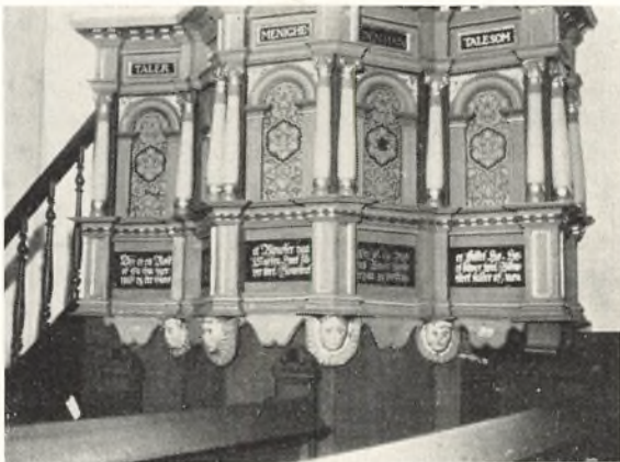
Prædikestolen i Nr. Nissum Kirke

Vi vil nu se lidt paa Kirkens Indre, som det var i den første Tid. Lige inden for Døren finder vi Døbefonten.