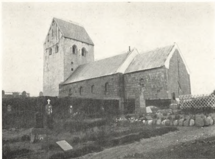
Nørre Nissum Kirke

har haft den ældste Bebyggelse. Vi ser ned over de lave Hytter »af Ris og Kviste«, der dannede en Langby fra Øst til Vest lidt Nord for Kirken. Maaske faar vi Øje paa Krigsfolk, der drager ind i Gaardene, og venter vi lidt, ser vi dem igen komme ud derfra med Dragninger af Fødevarer. Det er dog ikke fremmede Krigere paa Røvertogt, men nogle af Hær-