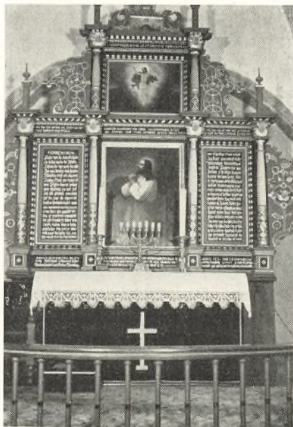
Nørre Nissum Kirkes Alter

Hvis vi nu en Dag henimod Slutningen af 1400 s Tallet stod her paa Kirkebakken, kunde vi maaske se lysende, hvide Taarne ved flere af Kirkerne i Synskredsen, og her i Nissum begyndte man da ogsaa at