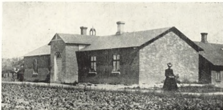
Nr. Nissum gamle Missionshus

K. F. U. M. holdt Møder paa samme Maade som Klassemøderne, ikke mange, men vel 4—6 om Aaret. Det var ikke saa lukket en Kreds som Klassemøderne, men til Gengæld gav det Friskhed at mødes med Folk fra de andre Klasser. De havde den Skavank, at Gesvindttalere (det