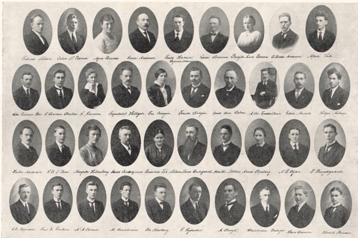
25 AARS JUBILARERNE