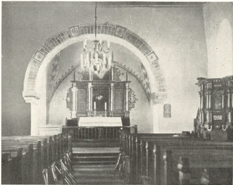
Nr. Nissum Kirke indvendig

Deres unge Kvinder har som nu staaet for den samme Font med deres smaa og har holdt dem over Daabens Vande og