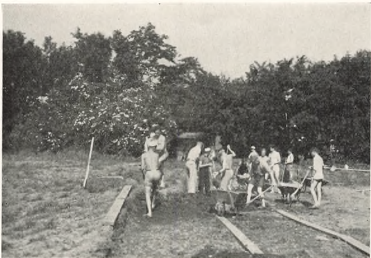
Der arbejdes paa Sportspladsen

delen af den samlede Udgift; dermed var Sagen bragt over det døde Punkt, hvad angaar det økonomiske. Et andet stort Problem var Arbejdskraften, som jo paa Grund af Forholdene var anbragt andet Steds; men ogsaa dette Spørgsmaal løste Eleverne. Mod almindelig Arbejdsmandstarif tog de Reguleringen i Akkord, og med denne Beslutning var den gamle bakkede Bane dødsdømt. Kristi Himmelfartsdag gjorde den Tjeneste for sidste Gang (Fodboldkamp Seminariet mod Struer); Dagen efter blev den pløjet, og ved Sommerferiens Begyndelse rykkede Elevernes første Arbejdshold, 30 Mand, i Marken til en 14 Dages Tørn, efterfulgt af andre 30 de næste to Uger; hvad der yderligere manglede, blev gjort færdigt ved et Krafttag i Skoleaarets Begyndelse. Det var en Fornøjelse at følge, hvordan den muntre, ivrige Ungdom sled med Grebe, Skovle og Trillebøre, og ikke mindre fornøjeligt var det at se Bakkerne forsvinde, indtil Pladsen laa færdig, plan som et Gulv. Da var der flyttet cirka 4000 m 3 Jord og foretaget Uddræning, og dertil var medgaaet ialt 6741 Arbejdstimer. Endnu er der meget at gøre med Finregulering og Anlæg af Løbebane Pladsen rundt m. m.; men vi haaber inden den kommende Sommers Slutning at være naaet frem til den store Dag, da Pladsen kan indvies.