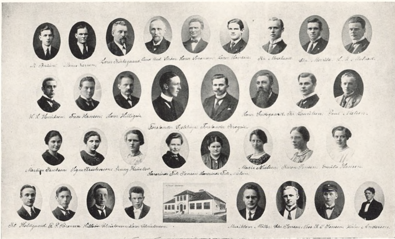
25 AARS JUBILARERNE