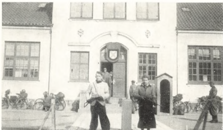
Opbrud den 6. Maj 1945. Frihedskæmpere staar Vagt

noget stort, var det største, at det meget stærke Ord: Som dine Dage er, skal din Styrke være , var ikke en tom Frase, men noget, man omend i Bæven kunde holde fast ved.