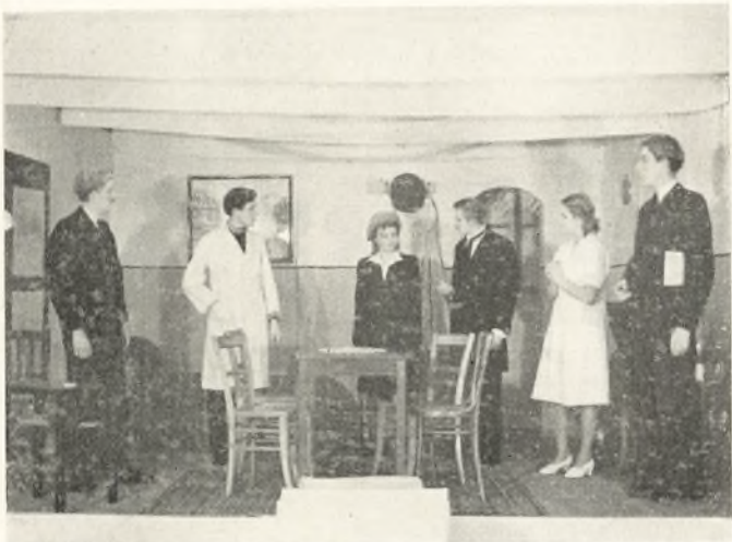
Fra Elevfesten 1946