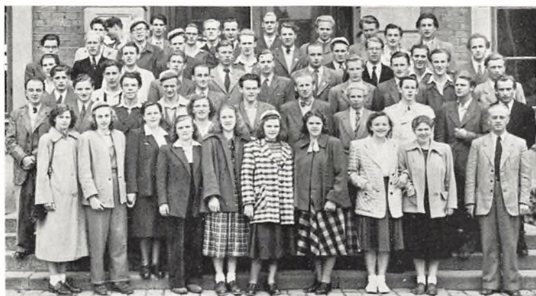
De danske gæster og svenske værter ved afrejsen fra Linköping banegård Desværre mangler enkelte

svenske foran den statelige seminariebygning, og foran hotel »Westend«, hvor vore piger boede som prinsesser.