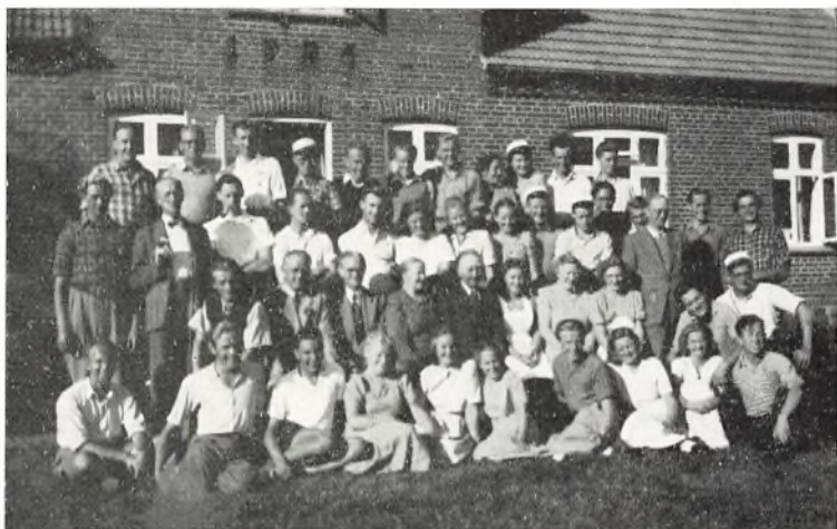
Fra lejrskolen på Velling Østergaard