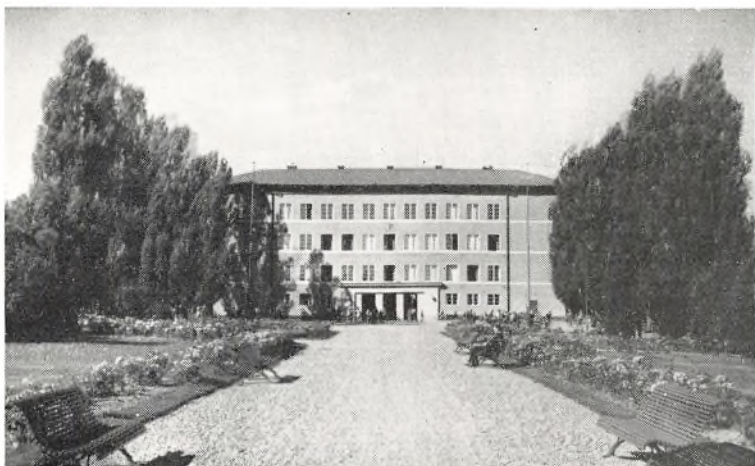
Folkeshøjskoleseminariet i Linköping