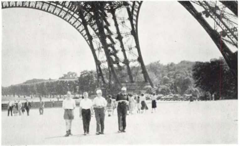
Vi forlader Eiffeltårnet. Billedet giver et indtryk af tårnfodens mægtige dimensioner

og kunne ikke lade være med at ønske, at denne krigsforgudelse ville ophøre, at disse krigsminder ville blive fjernet fra denne kirke og afløst af stille bønner til Gud om at skåne os for den slags store mænd, der planter kors og spreder død og elendighed, og befri os for den flok krigsgale og æresyge napoleonsparalleller, der i dag står i spidsen for verdens nationer. Napoleons grav var storslået, pragtfuld og imponerende. Den havde kun een fejl, en meget, meget væsentlig fejl. Den stod som minde over en af historiens største krigsanstiftere. Vi er angst for krigen, og vi skælver for krigen, men vi forguder, og vi tilbeder dens mænd. Hvor er vi i grunden mærkelige, vi små idioter, der befolker denne ulykkelige verden.