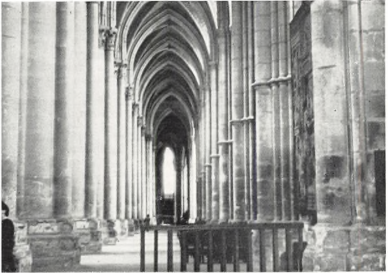
Sideskib i Rheims domkirke. Kirkens længde indvendig 139 m og buerne i midterskibet 38 m høje, d. v. s. højere end Rundetårn

stand. Vi var ganske betaget af dette landskabs storslæthed og ynde.