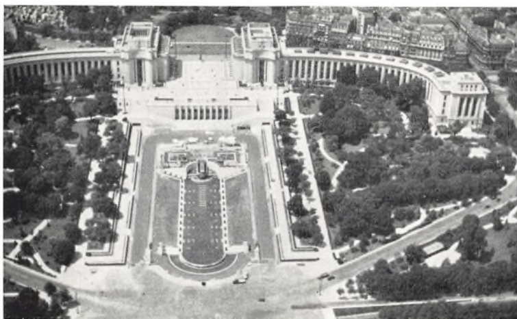
Den forhenværende Trocaderoplads med Palais de Chaillot, set fra Eiffeltårnet

ninger og atter bygninger. Man pegede og nævnte navne som le palais de Chaillot, l'Arc de Triomphe, Place de l'Étoile, Place de la Concorde, le Grand-Palais, la Basilique du Sacré-Cœur, Notre Dame, og mange, mange andre. Hele byen lignede her oppe fra en kæmpemæssig modelby, en modelby så fantastisk, som kunne den aldrig blive virkelighed. Men, den var virkelighed. Den hed Paris. Vi var i den. Vi var ved at opleve den.