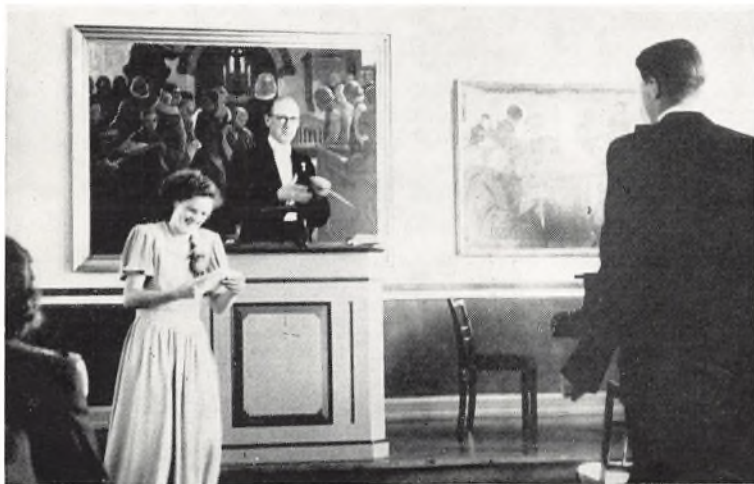
Fra dimissionen 1950. Eksamensbeviser uddeles

nerer får lejlighed til at lade deres lys skinne i timerne, som for lærerne; det kræver en betydelig anspændelse at undervise så store klasser; det gælder i alle fag, særlig i dem med skriftligt arbejde og på specialeholdene. Når lærerrådet alligevel år efter år beslutter at optage så stor en I klasse, skyldes det dels hensynet til de mange skuffede aspiranter, dels vort ønske om at medvirke til at afhjælpe lærermangelen. Men det kan næppe vare mange år, før vi må ned på klasser af mere normal størrelse.