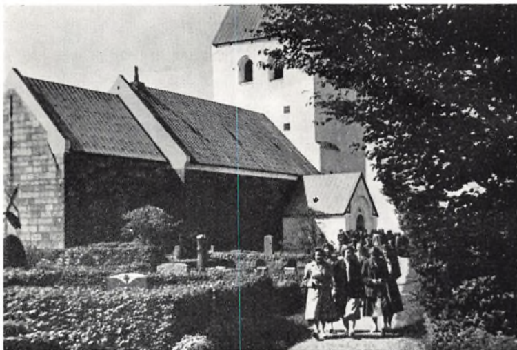
Man forlader festgudstjenesten i Nr. Nissum kirke

der altid havde en anekdote på lager til at live op i tilværelsen med, og — så vidt jeg husker — en gammel muskendonner, som han, der ellers slet ikke var krigerisk anlagt, eksercerede med i sine ledige timer, og med hvilken han i tilfælde af angreb fra naboerne i tomandsværelserne ved siden af holdt sig dem to skridt fra livet. Han var fra købstaden og var vist en af de bedste blandt kammeraterne til „at file af“ på sprog og opførsel, og der var ikke så lidt at file på og slide af hos de fleste af os.