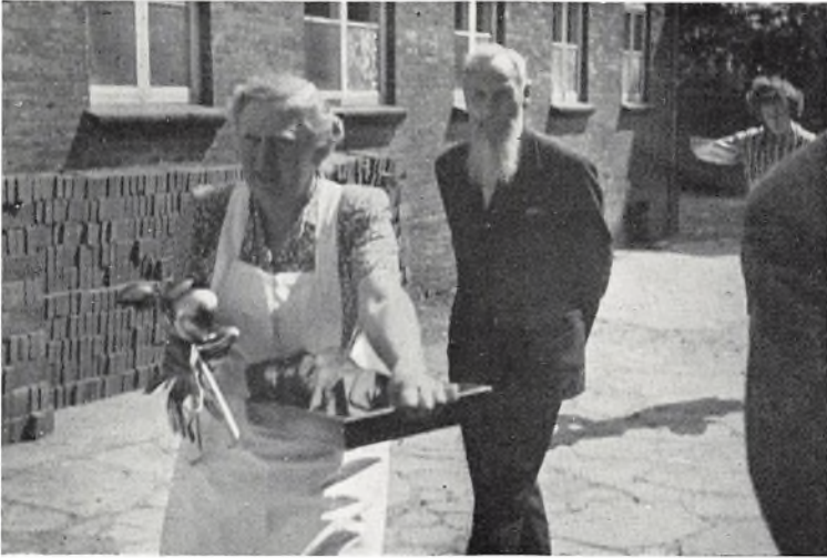
Økonoma frk. Storgård havde en travl dag. Humlum (01) bagved

gaver som bidrag til et nyt klaver (jfr. det ovenfor fortalte om Hellasfonden). Derpå fulgte talerne slag i slag, alle med et trofast håndslag til seminariet og dets gerning. Kl. 20½ sluttede komitéformanden med en kort andagt, hvor han talte om seminariets eksistensmulighed og eksistensberettigelse.