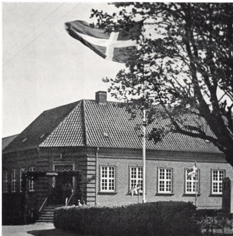
Smykket til 60 års festen