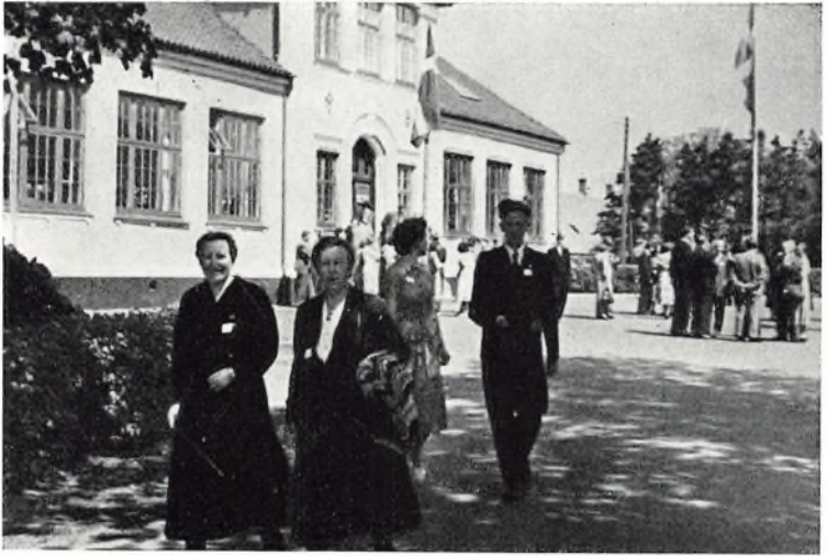
Det usædvanlig smukke majvejr indbød til frit samvær i det frie

lovprise ham. Efter andagten standsede mange ved de forskellige grave, der havde tilknytning til seminariet — pastor Ad. L. Hansens og adskillige andre, hvor stævnet i dagens anledning havde lagt blomster.