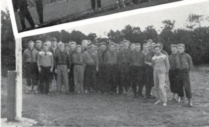
Øverst: «Den kolde krig» på Højelebar ved Innsbruck. I midten: Sem.s sportsdag. Nederst: Sem.s KFUMs fører-spejdersgruppe på Sundbyerg-tur