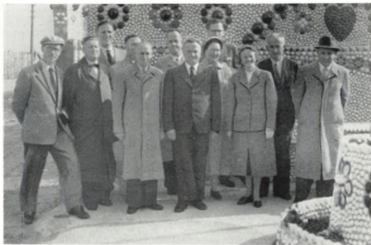
25 års jubilærer, fot. ved »Sneglehuset«, Thyborøn