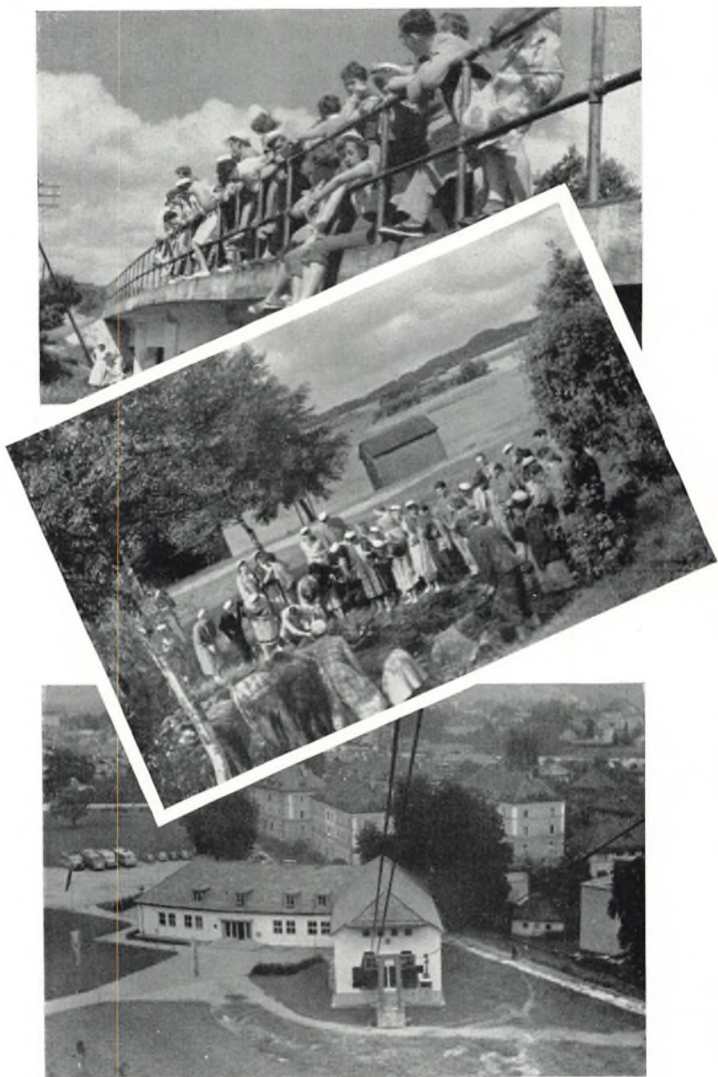
Øverst: Fra lejrskolen, II kl. I midten: Ligeledes fra II kl.s lejrskole. Nederst: III sem. overgiver sig til søvebanen i Hallein (v. Salzburg) på vej til turen gennem saltminerne