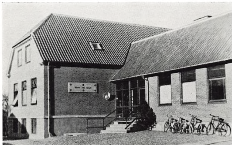
Den nye bygning i brug