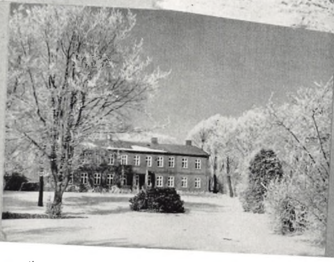
Øverst til venstre: Praktikeksamen i Østre. Derunder: Sidste klassedag i IV. Øverst til højre: På vej mod Korinth. Nederst: Forstanderhaven i sne