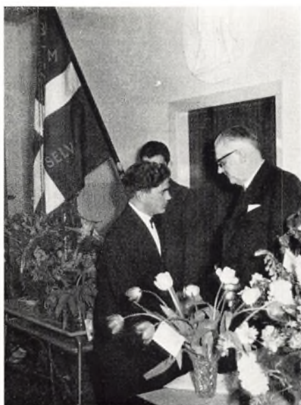
Elevforeningens formand overrækker gavebrevet på 10 500 kr.