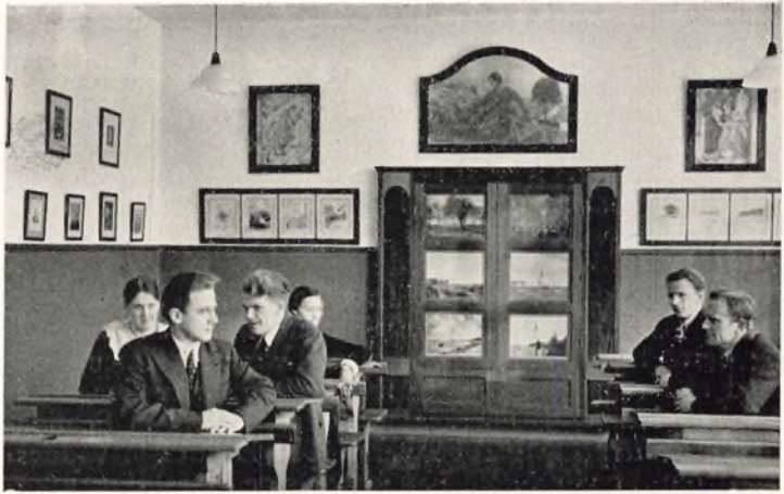
IV. Klasses Lokale

kert er Aarbogens Læsere velkendte. Kun enkelte Ting af mere speciel Art skal fremdrages.