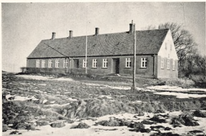
Gamle Østre Skole

I 1818 udarbejdede man en ny Skoleplan, hvorefter der skulde oprettes en Vestre Skole, og Embedsindtægterne deles mellem de 2 Lærere (med nogen Forhøjelse naturligvis). Men da man havde faaet det hele stillet pænt op, stødte man paa det Spørgsmaal, om »Lyne havde Privilegier«. Det havde han desværre, og Skoleplanen af 7. Maj 1818 maatte derfor gemmes til efter Lynes Død. Dog erstattedes det gamle Omgangsskole-