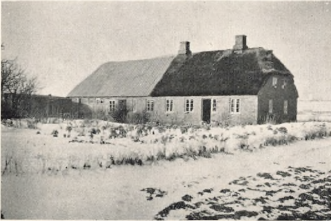
Den gamle Degnebolig