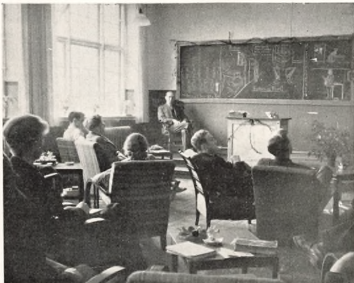
Den sidste Skoledag

Afsluttende Eksamen begyndte 3. Maj (skr. Eksamen)