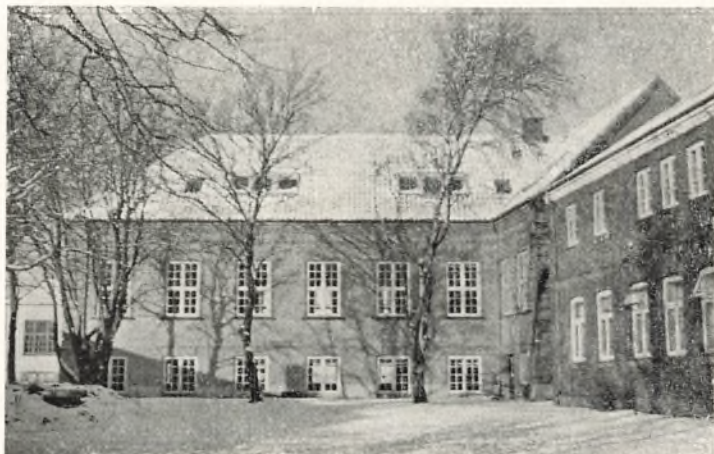
Den nyeste Seminariebygning

lerne til et nydannet Aktieselskab 1906 for 96.000 Kr. En anden Grund nævner han dog ogsaa i Aarsberetningen 1906: »Det har altid staaet for min Tanke som noget skønnere og rigtigere, at indre Missions Venner selv ejede og drev en saadan Skole, som først og fremmest bør tjene Guds Riges Sag.«