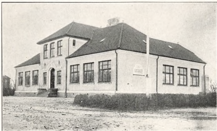
Den nye Seminariebygning