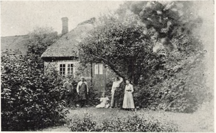
Nr. Nissum gamle Præstegaard

vil dette Forsøg blive Begyndelsen til Oprettelsen af flere lignende Højskoler andre Steder i Landet.»