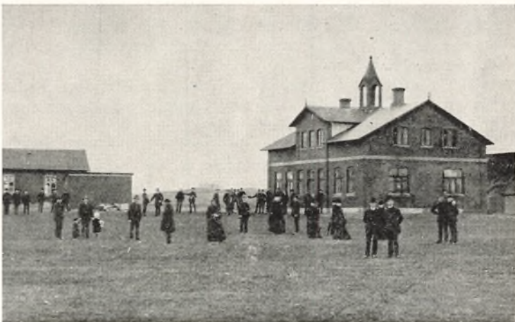
Den første Højskole