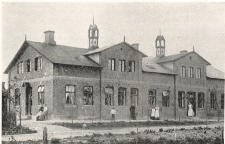
Højskolen efter en Udvidelse