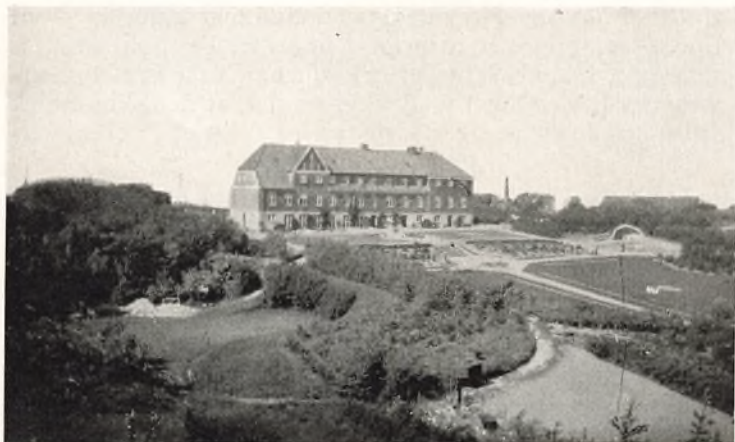
Den nye Højskole

og K. i Lemvigkredsen siden 1935 har afholdt henholdsvis Vinter- og Sommerlejr der.