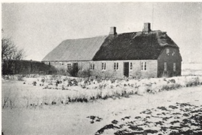
Den gamle Degnebolig i Nr. Nissum