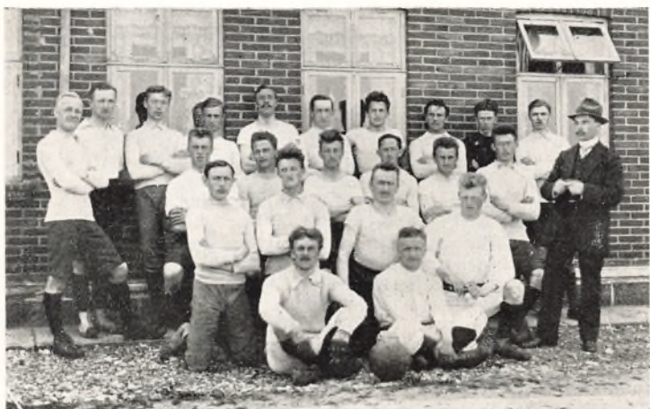
Begge Hold fra Ranum-Nissum Kampen Grundlovsdag 1913

der blev Arvefjenden i de følgende Aar. Begyndelsen blev gjort Grundlovsdagen 1913 (en Uge efter Bøvlingsturen). Referat i »Dæmring« No. 17.