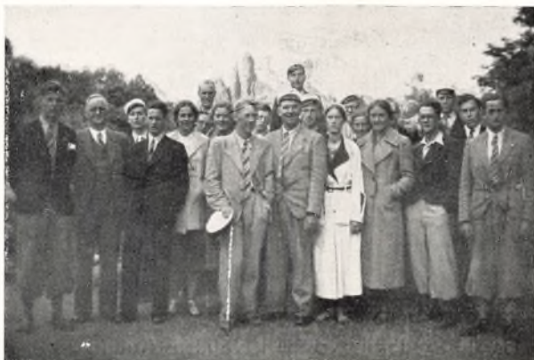
Deltagerne fotograferet i Hagenbecks Dyrepark