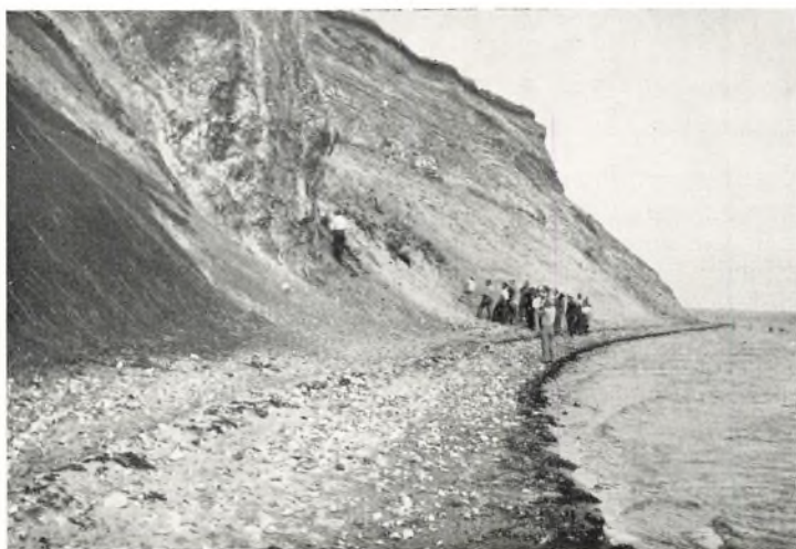
En Limfjordsklint. — Forrest en Del af en stor Foldning. Længere tilbage bølgede Lag af Moler og vulkansk Aske.

Jorder manglede Kalk. De blev enige om at anlægge et Mergelspor til Bur med Endestation tæt ved Dronninggaard. Adskillige af Seminarieeleverne fra den Tid fik sig en billig interessant Tur med Tipvognsføreren til Bur. Her saas, hvorledes en Gravemaskine afgnavede Mergel i Gravens skraa Side, hvorefter det løftedes og blev læsset paa Tipvogne.