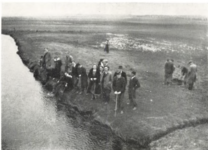
Flodsandslette ved Karup Aa.

heden af, hvor Fousing Kirke nu ligger. Vandet afsatte et Lag Sand over et stort Areal, nemlig over hele Klosterheden. Hjemstavnskortet for Nissum og Omegn, som er udgivet af Geodætisk Institut, viser særdeles klart, at der kun er ringe Bebyggelse Syd for Isvandslinien, hvor Flodsandet er aflejret, medens det modsatte er Tilfældet nordpaa, hvor Moræneleret ligger; Kortet paa den Del er overfyldt med Gaard- og Bynavne.