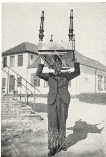
Den tunge Forberedelse til skriftlig Eksamen.

optoges 26. Desuden optoges 4 Præliminarister og Realister uden Prøve. Der var altsaa 16 Aspiranter, som ikke naaede at komme ind. Som saa ofte før var der saaledes lagt en Dæmper paa de lykkelige Glæde over at være optaget; alle følte med de skuffede Kammerater. Dog maa det jo siges, at det er bedre at begrænse Tilgangen, saaledes som Ministeriet gør ved at fastsætte Maksimumstal for Optagelsen, end at slippe alle de bestaaede ind paa Seminarierne og derved skabe en stor Overproduktion af Lærere.