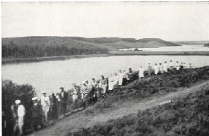
Paa Tur langs Søen

er Naturhistoriker, skal jeg imidlertid afholde mig fra at beskrive disse Ekskursioner nærmere.