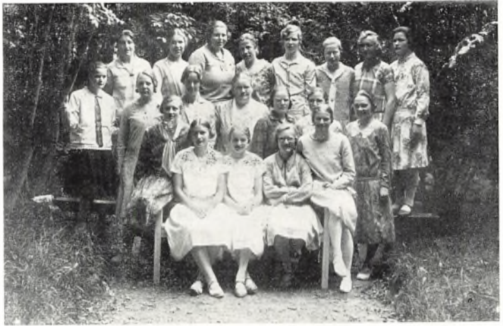
Seminiariets K. F. U. K. 1930