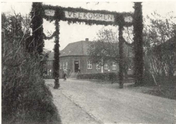
Æresporten ved Seminariet

Gaver: fra Lærerstaben et Solur, fra en gammel, unævnt Elev et Legat paa 2000 Kr., hvis Renter skal uddeles til en trængende Elev, og fra de nuværende Elever et mægtigt Dannebrogslag, der blev baaret ind og overrakt af unge Piger i hvidt og rødt, og for hvilket Forstanderen tak-