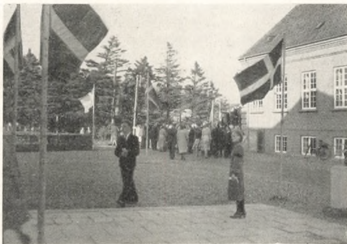
Seminariepladsen med Soluret

lede sig til Tjeneste med Raad og Daad. Fra alle Sider mødte Fests- komiteen Støtte og Velvilje. Sognets Beboere tilbød at tage mod Gæster; Eleverne afgav Værelser — nogle rykkede endog i Telt for at skaffe Plads — eller fungerede som Marchaller, Opvartere og meget andet. Tak-