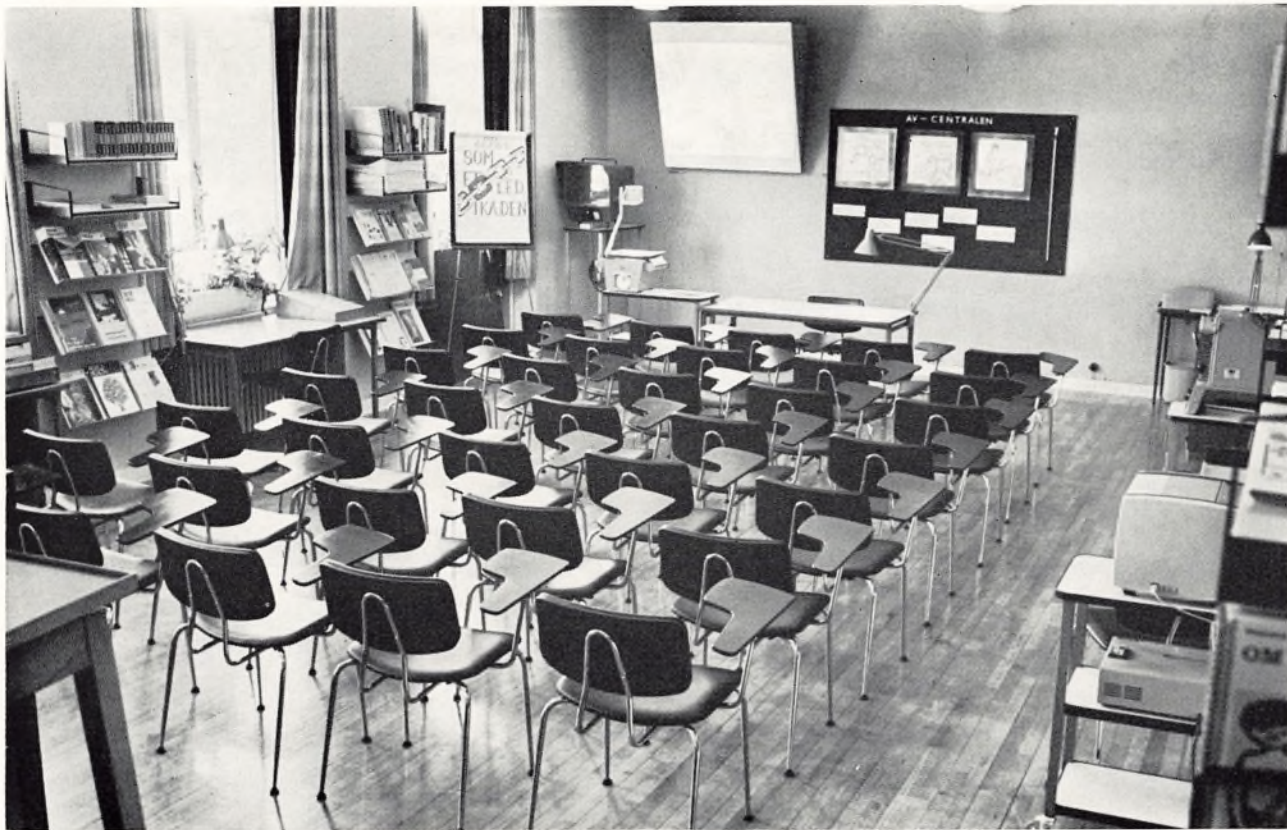
AV-Centralens nye lokaler: Instruksionslokalet.