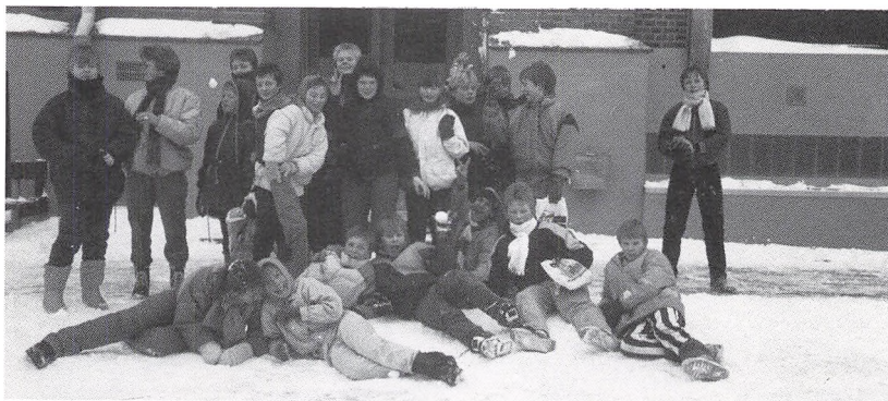
Ud i den kolde sne!