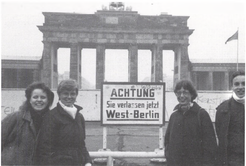
Foran Brandenburger Tor

Bummel. Aftenen sluttede på en typisk berlinerknejspe, hvor flere af os prøvede den berømte »Berlinerweisse mit Schuss«, en overgåret, stærkt skummende øl tilsat hindbærsaft og drukket med sugerør.