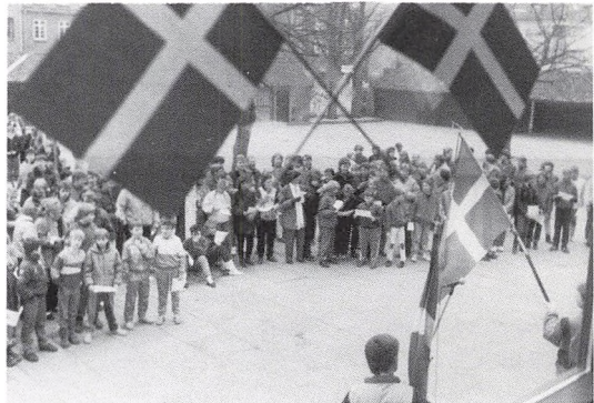
Fra skolens 70 årsdag