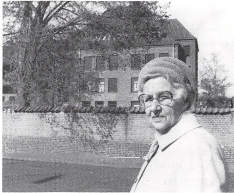
Fru Sielemann indskrevet i 1. klasse april 1917

Det var kun halvdelen af skolen, der blev færdig i 1917. Det var den nordlige fløj og nederste etage af midterfløjen. Færdiggørelsen med sydfløjen og midteretagens etager skete i 1921. I 1918 toges skolekøkkenlokalet i 1920 toges skoletandklinikken i brug, og i 1920 oprettedes på Bordings initiativ »værneklasse« – en hjælpeklasse. I 1932 oprettedes en viceinspektørstilling, og i 1934 begyndte lærerstude-