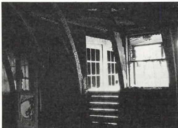
Et hjørne af lejrskolen efter branden.

Allerede inden branden havde tanken om bortflytning været oppe; egnen havde på grund af det ganske overhåndtagende sommerhusbyggeri ganske skiftet karakter. Ikke blot var det smukke udsyn spoleret, men egnens landlige karakter var gået tabt. Opgavearbejdet blev på en lang række vigtige punkter bestandig vanskeligere, var det muligt at fortsætte på dette sted?