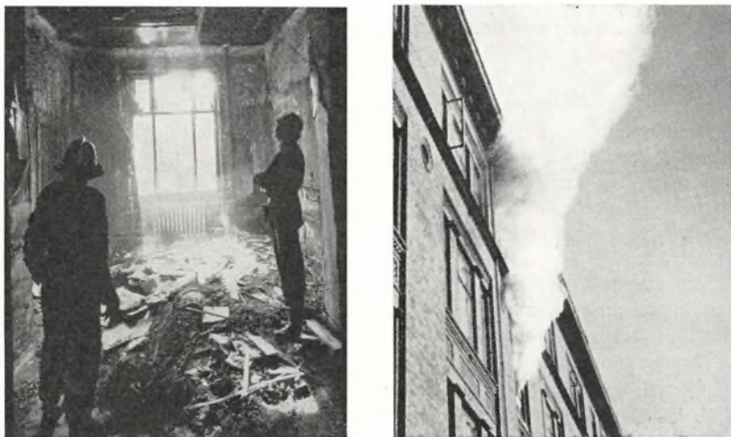
Skolens brand 29. maj 1961.

havde i forbløffende kort tid fået voldsomt fat. En lykke var det, at vi få år tidligere havde fået etableret nogle hæslige og besværlige, men åbenbart effektive, branddøre på gangene. Takket være dem og brandvæsenets hurtige udrykning lykkedes det at begrænse ilden til inspektionskontoret, trappegangen, regnskabsførerkontoret direkte over inspektionskontoret, samt mindre skader på de tilstødende lokaler.