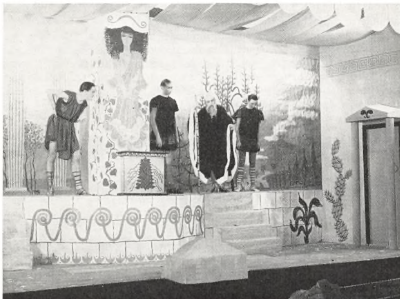
Scenebillede fra opførelsen af Plautus: »Mostellaria«.