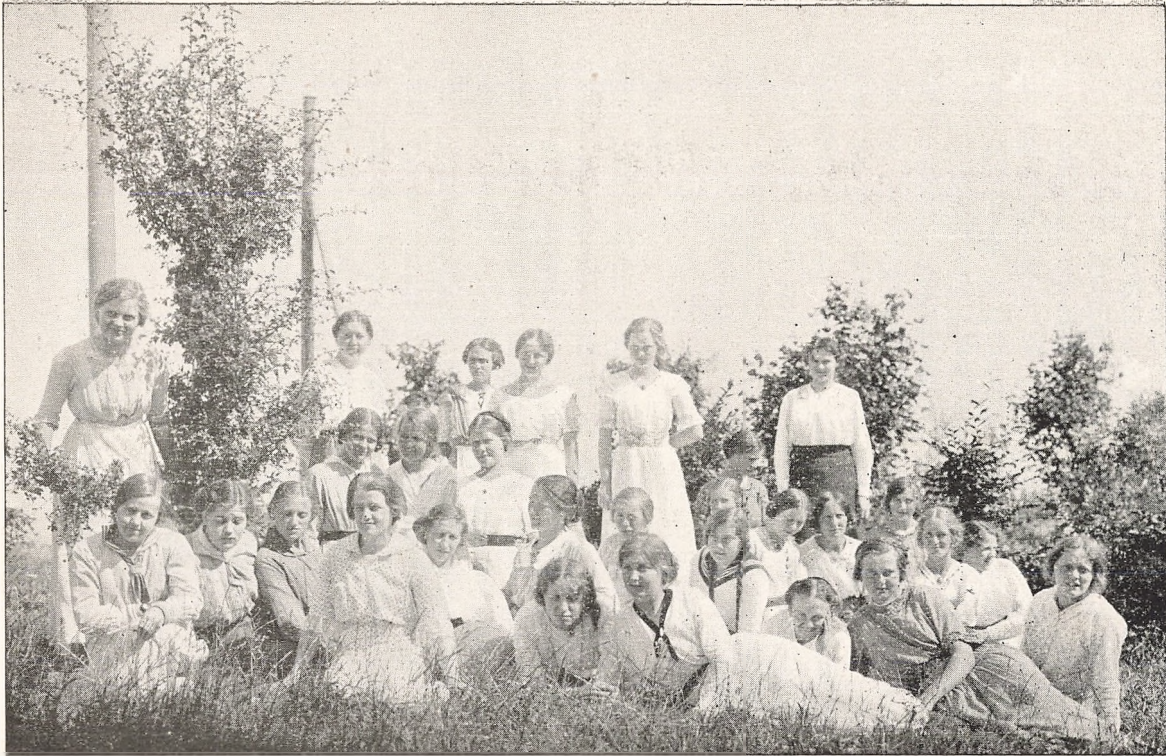
Piger paa Højen.