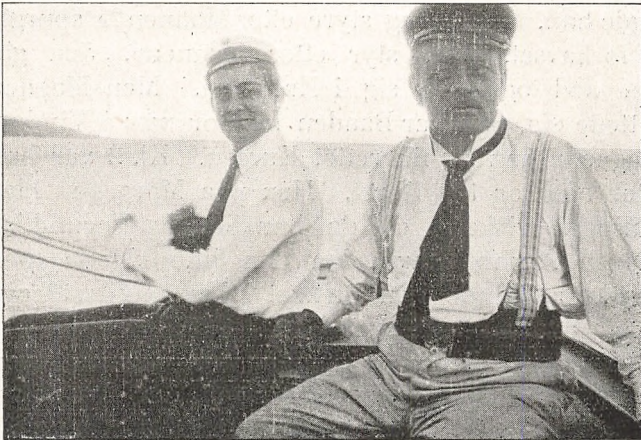
Skipperen har Roret.

Han havde haft noget Besvær med Slæbejollen, der i Søgangen paa Udturen havde sprængt Trossen. Deraf kom siden det Sagn, at hans Skib var drevet i Land paa Stranden, og han selv var forsvunden. Hans Bekendte spejdede i Aviserne efter en Nekrolog, men da den ikke viste sig, begyndte de at haabe, at han alligevel var sluppet fra det med Livet.