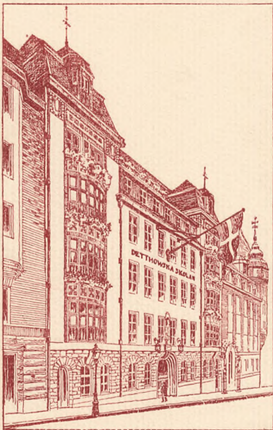
Skolhuset Eriksbergsgatan 10 Stockholm