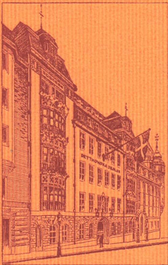
Skolhuset, Eriksbergsgatan 10 Stockholm