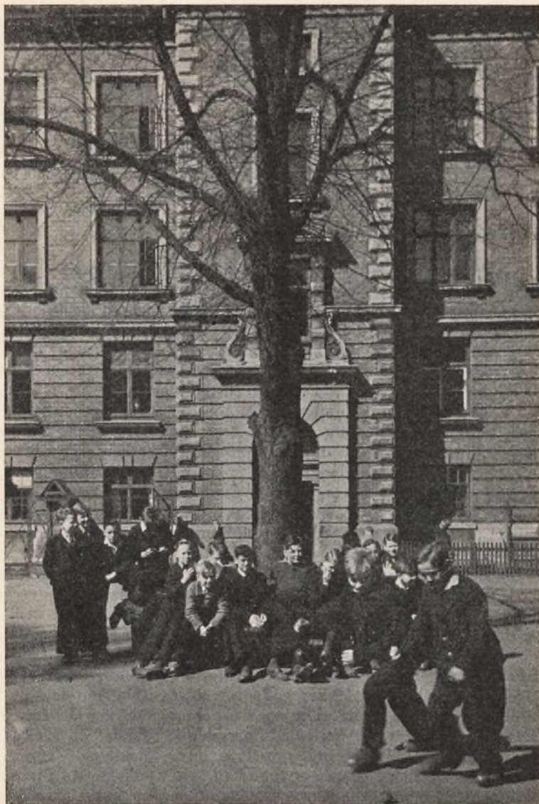
Parti fra Skolegaarden — Rundbænken omkring Linden.