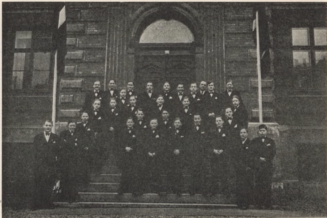
Konfirmanderne Aaret 1946