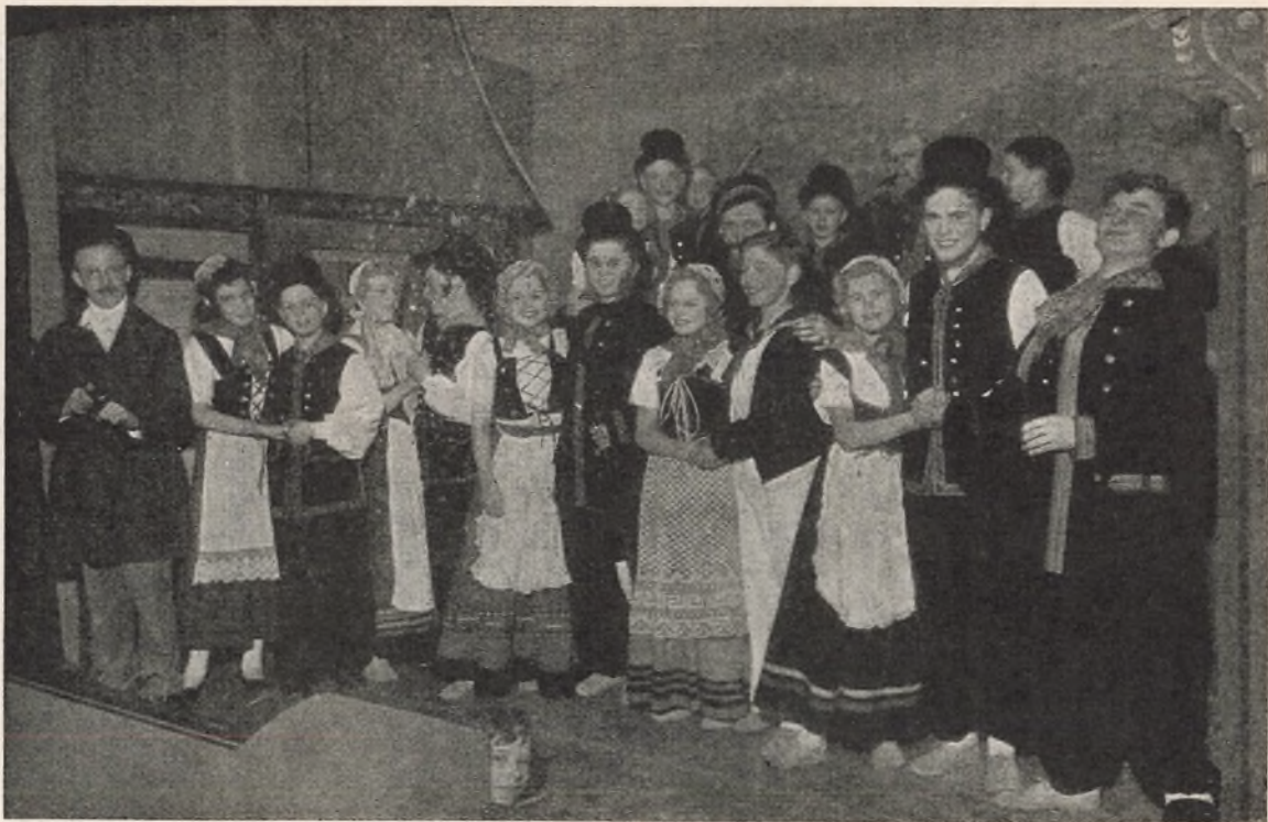
Slutningscene fra Skolekomedien „En Søndag paa Amager“ (8.-9.-10. Marts 1946).