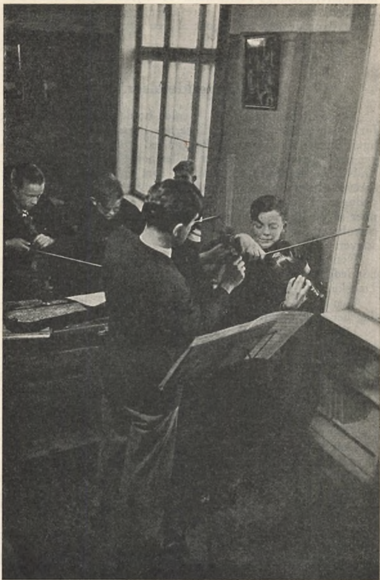
En Time i Musik. Alle Drengene med Anlæg herfor faaar Adgang til at lære at spille Violin. Drengene gaar op heri med stor Interesse. Skolen har sit eget Orkester, som optræder ved festlige Lejligheder — ved Stiftelsesfesten, ved Skolekomedien og ved særlige Koncerter.