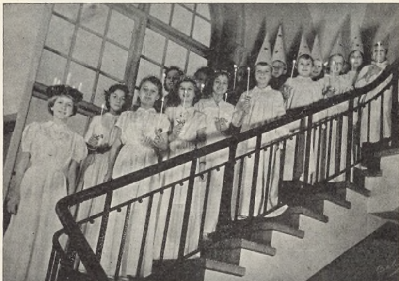
Luciaoptog på Nørrevold Skole.

11. november: Forældremøde med rundbordssamtale (over 200 tilhørere). Emne: Hvorledes skal vi opdrage vore børn? Del-