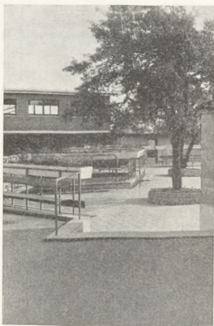
Småbørnsgården set fra skolegården.