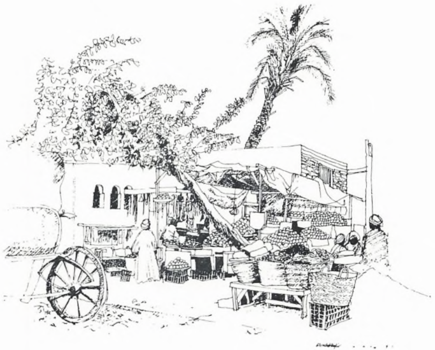
Tegning fra en af basargaderne udført af gruppens engelske deltager Elisabeth Taylor.

soner. En kuglepen kunne give en skoleelev – ja, selv en familie på landet, en anseelse, der kunne nydes godt af, så længe pennen duede.