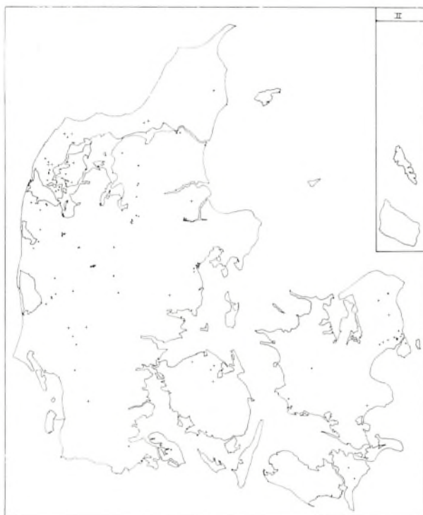
Oprindelsessted for Nr. Nisum Seminariums studenterklasser \frac{3}{4} 1969 En prik = en studerende Bornholm og dele af Færøerne er indsat.