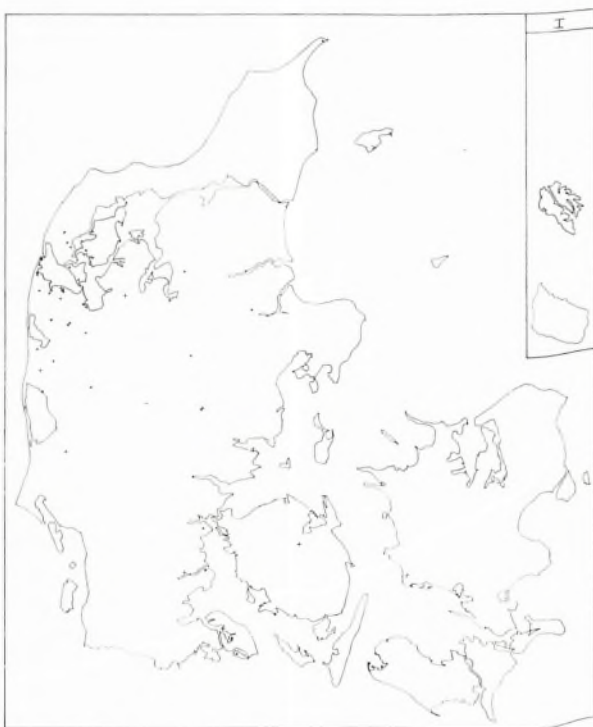
Oprindelsessted for Nr. Nissum Seminariums HF-studerende 9/4 1969. En prik = en studerende. Bornholm og dele af Færøerne er indsat.

Foruden ovennævnte faktorer kan nævnes tidssvarende bygninger, der er indrettet i overensstemmelse med moderne undervisningsprincipper, de righoldige samlinger og seminariets undervisningsprogram. Hertil føjer sig gode fritidsmuligheder ved nærliggende kunstner-,