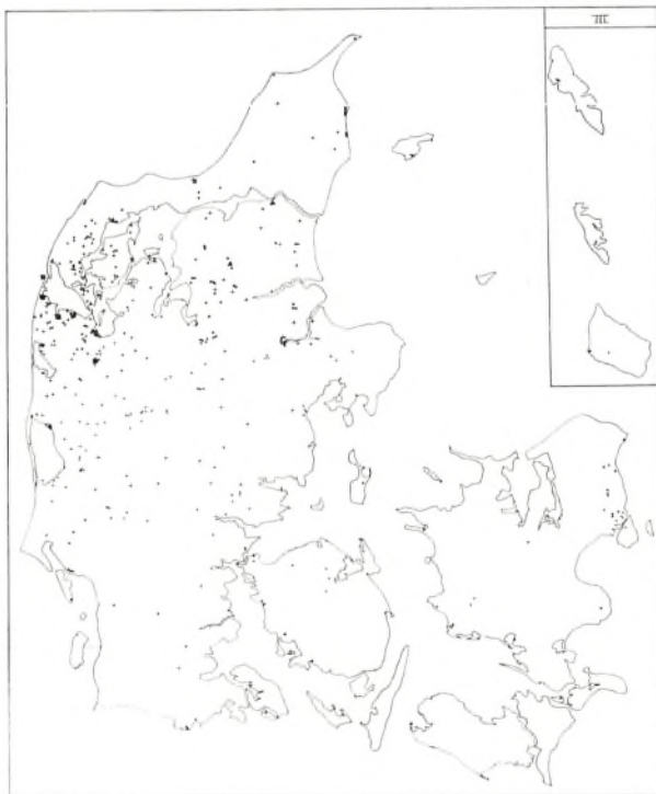
Oprindelsessted for Nr. Nisum Seminariums normalklasser \frac{3}{4} 1969 En prik = en studerende Bornholm og dele af Færøerne er indsat.