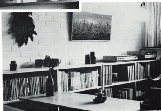
Glimt fra Ad. L. Hansens kollegium