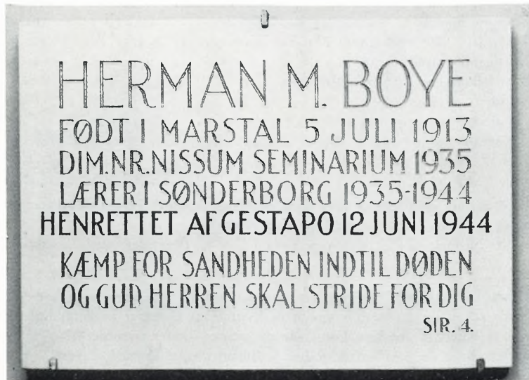
Et 25 års minde