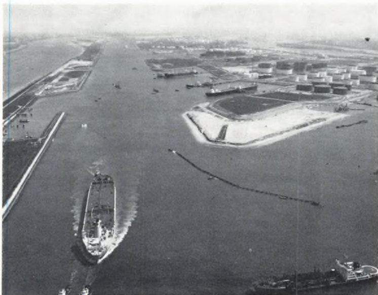
EUROPOORT. Caland Kanal med Scheur haven tv. og Nieuwe Waterweg. Th. Beneluxhavn, Shell lagertanke ved 4. petroleumshavn. Bagved 5. petroleums- havn med Esso og Gulj raffinaderier. I baggrunden th. Hartel Kanal.

magten fra menneskene. Det var fantastisk at se, at produktionen ikke var ensartet, men at man fremstillede forskellige biltyper imellem hinanden. Hele produktionen var EDB-styret, således at man kunne fremstille biltyperne i den rækkefølge, som ordrene indløb fra forhandlerne.