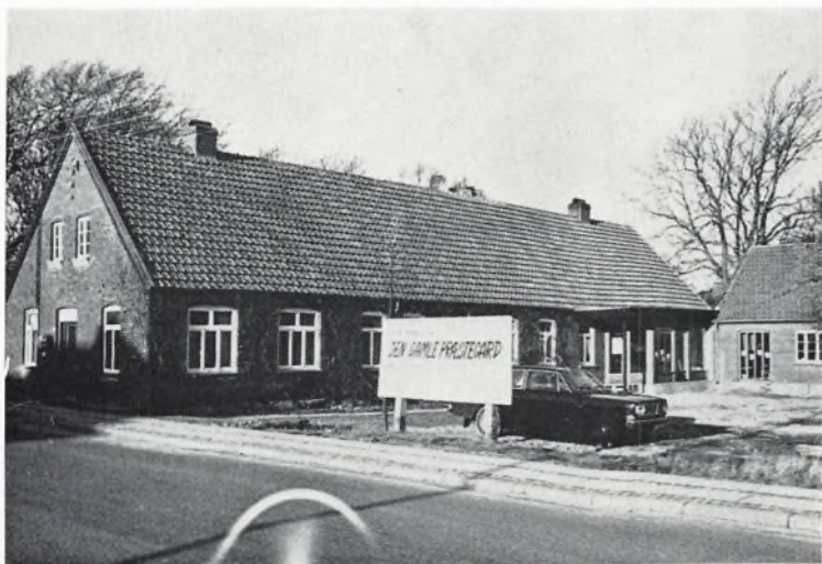
Posthus, cafeteria og fritidslokaler under ét tag.

Igennem truslen om seminariets nedlæggelse kom vi. Kreditstramningen virkede også forhindrende. Men nu er bygningen indrettet med tre store cafeteria-lokaler, et moderne køkken, pejsestue, billardsalon og TV-stue. – Fra den gamle udbygning, som nu er indrettet til festsal, er der bygget en overdækket gang, hvorigennem man kommer