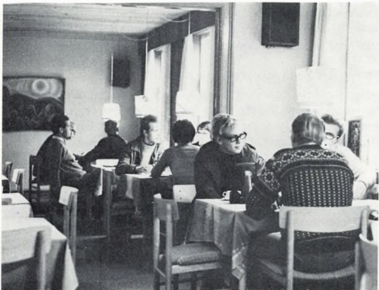
Et blik gennem cafeteriaet.

Institutionen har søgt og fået spiritusbevilling. Politimesteren i Lemvig udtalte i den anledning, at han med glæde medvirkede til, at vi i Nr. Nissum fik en sådan, da han kunne fornemme, at her ville vi netop vide at forhandle disse varer på en fornuftig måde. En avis på egnen fandt det forhold, at vi søgte spiritusbevilling, så epokegørende, at man i stor opsats skrev: „Præsten er med til at bryde afholdsmonopolet i tørlagt Nr. Nissum“. Ja, så begejstrede blev man for dette „frisind“, at hovedstadens afdeling af avisen også skulle bringe det.