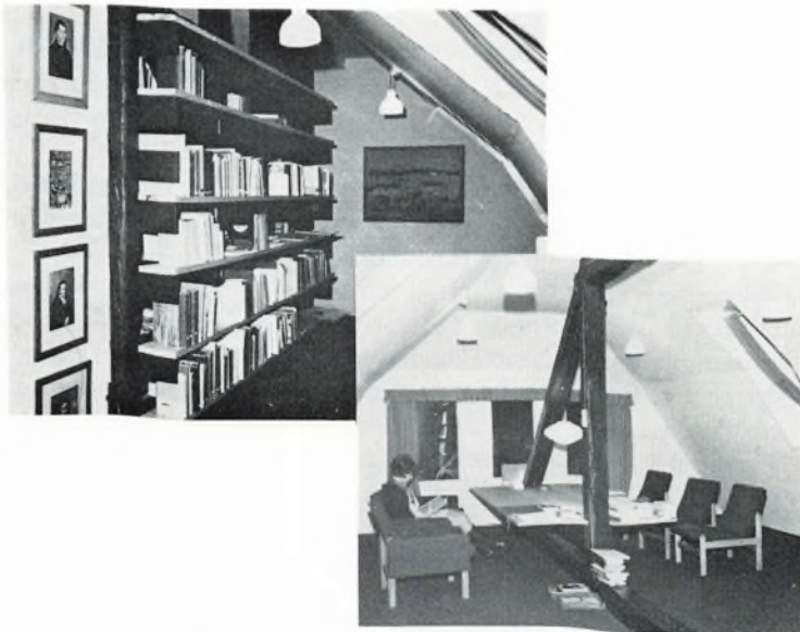
Det pædagogiske bibliotek under hanebjælkerne i „Den gåd“.