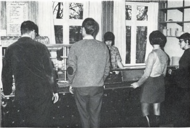
Tanker ved en disk.

ind til institutionen; en anden nybygning til huset er opført ved østgavlen og skal tjene til grovkøkken og lagerrum. Overalt er der tæpper på gulvene, træpaneler på væggene ud til haven og nye møbler. Anlægsudgifterne er på ca. 250.000 kr. Vi har modtaget gaver fra forskellig side på ialt kr. 35.931; restbeløbet er lånt i Lemvig Sparekasse med kommunegaranti og kaution i KFUM's sociale arbejde.