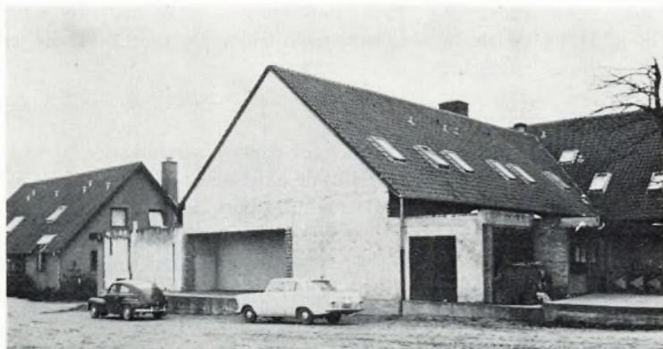
Seminariets mangeårige facade mod alfarvej, der nu får sin færdiggørelse.

Øvelsesskolen er dog nu strukturelt organiseret, idet Gudum og Nissum centralskoler i indeværende år sammensluttedes til én skole med fælles ledelse. Der er i vort område et holdbart børnetal til formering af en ideel øvelsesskole, og der kan imødeses en snarlig afgørelse vedrørende øvelsesskolens bygningsmæssige etablering som et led i ordningen af kommunens almindelige skolestruktur.