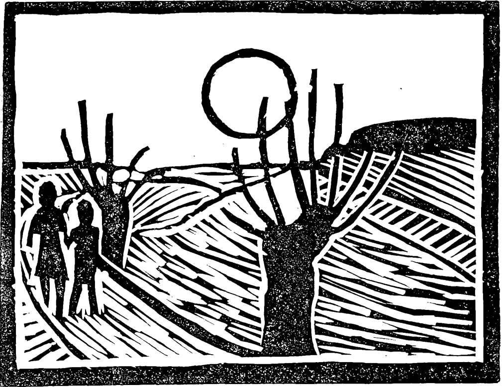
Linoleumssnit af Leif Haugaard