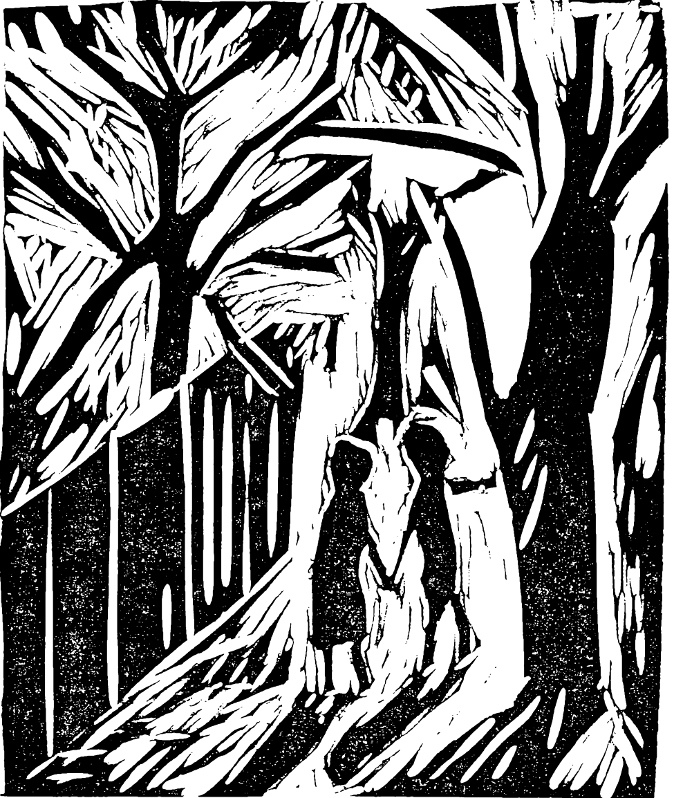
Linoleumssnit af Tage Holm