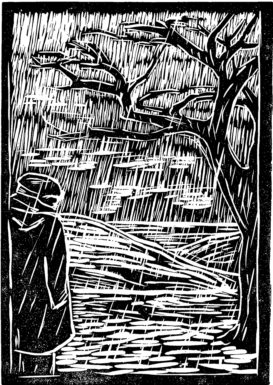
Linoleumssnit af Bjarne Andersen