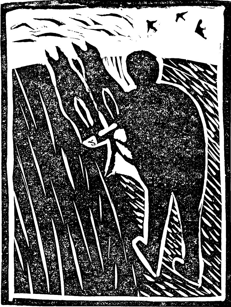
Linoleumssnit af Børge Thomsen.