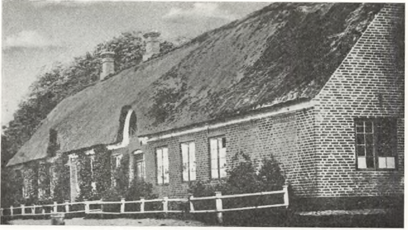
Den gamle øvelsesskole før 1904