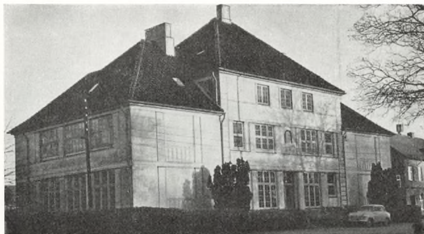
Jelling øvelsesskole 1904—1958