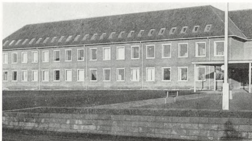
Den nye øvelsesskole set fra syd