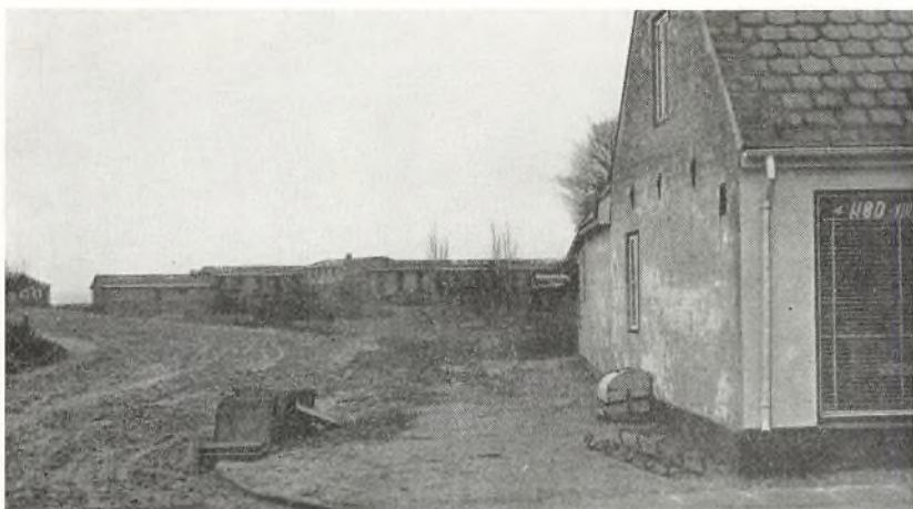
Gadegennemføringen ind til »Rosenvold«s arealer. Kollegiet ses i baggrunden