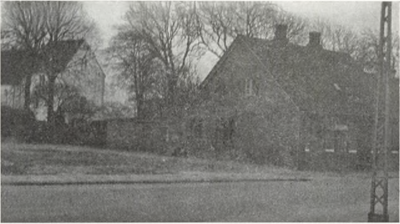
Da brugsforeningen blev revet ned, fik man det første kig ind til kirken fra hovedvejen