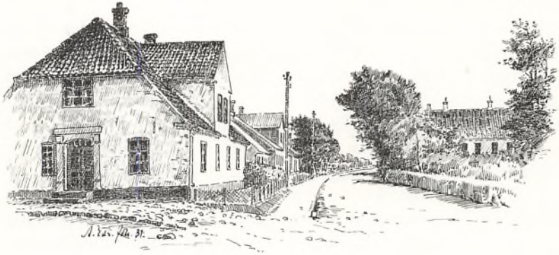
Trahns hus — Forskolens vugge