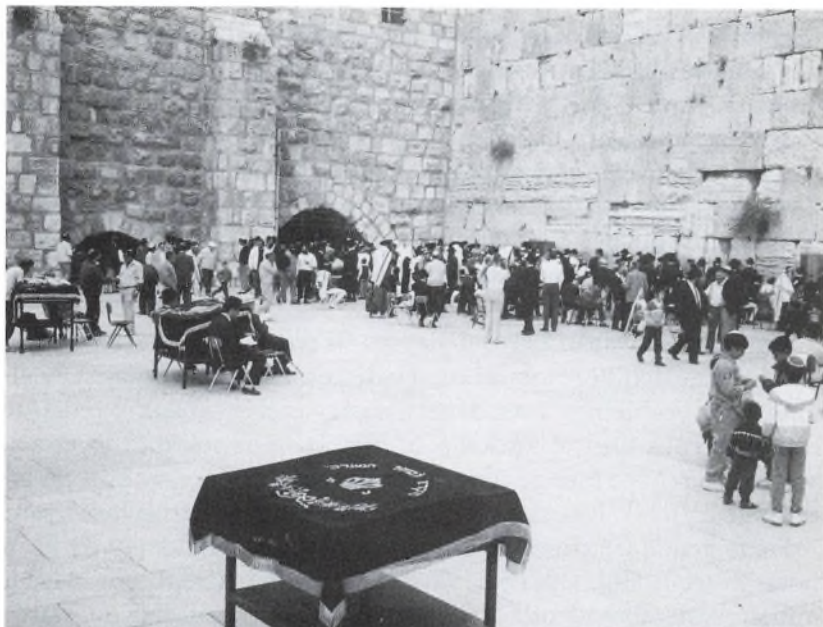
Grædemuren i Jerusalem.