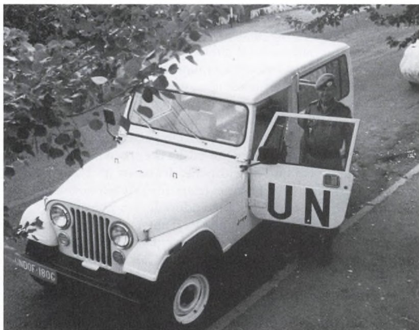
I Tiberias — klar til inspektion på Golan.