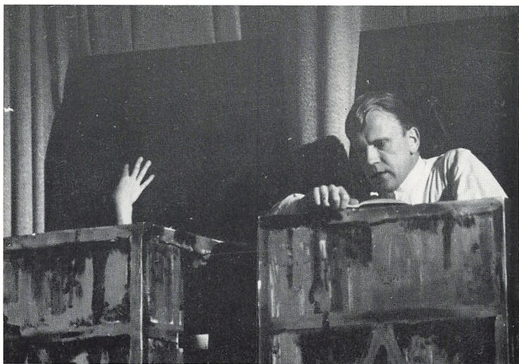
Fra en lærerlæsning af Becketts »Slutspil«.