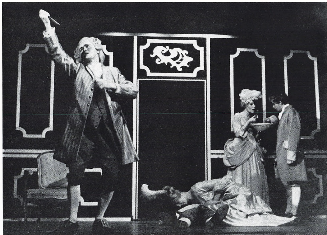
Eleveforestillingen 1966—67. Wessel: »Kærlighed uden strømper«.