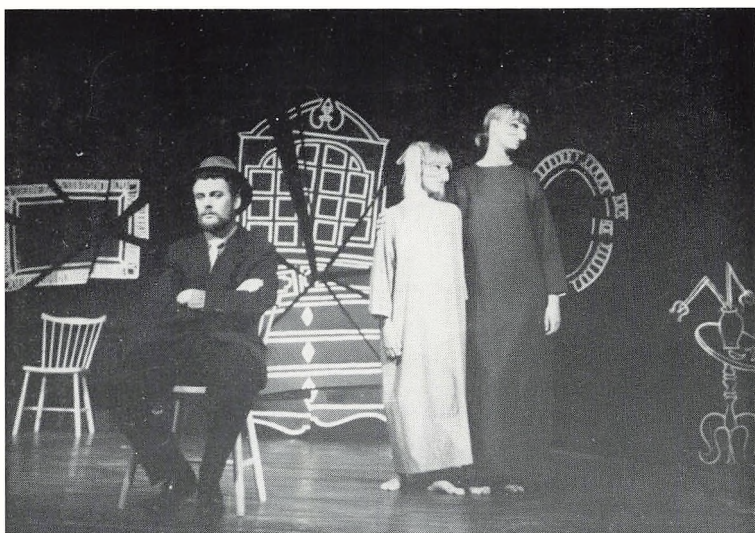
Fra elevforestillingen sommeren 1967. Ionesco: »Jacques eller Underkastelsen«.