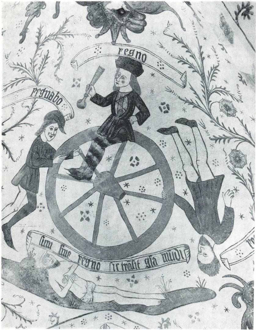
Tingsted-Maribo amt. Skæbnehjulet. Ca. 1400.