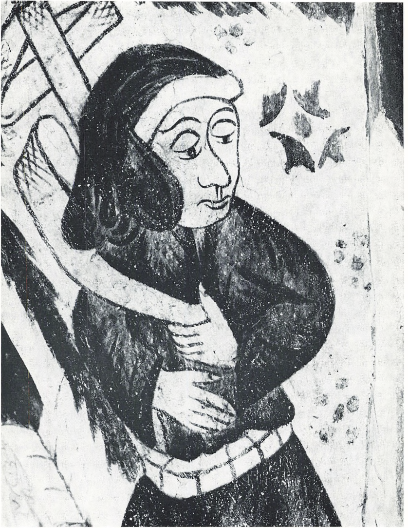
Bellinge. Odense amt. Mandsfigur. 1496.