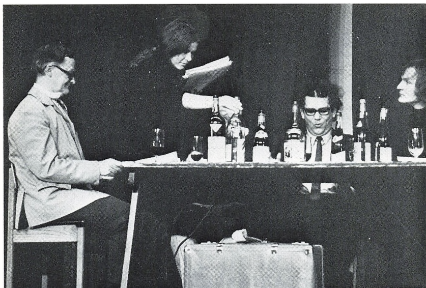
Husunderholdningens imitation af »Ophold på vejen«. (Sommerskolen).