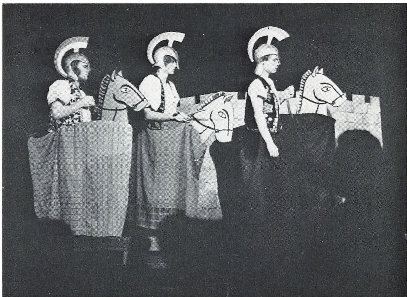
Generalprøve på elevforestillingen »Ulysses von Ithacia«. (Vinterskolen).