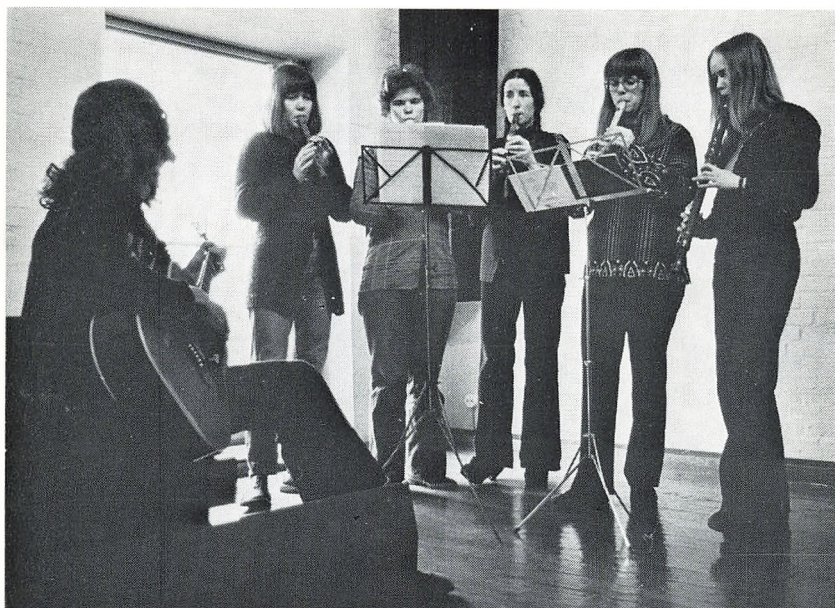
Instrumentalt sammenspil. (Vinterskolen).