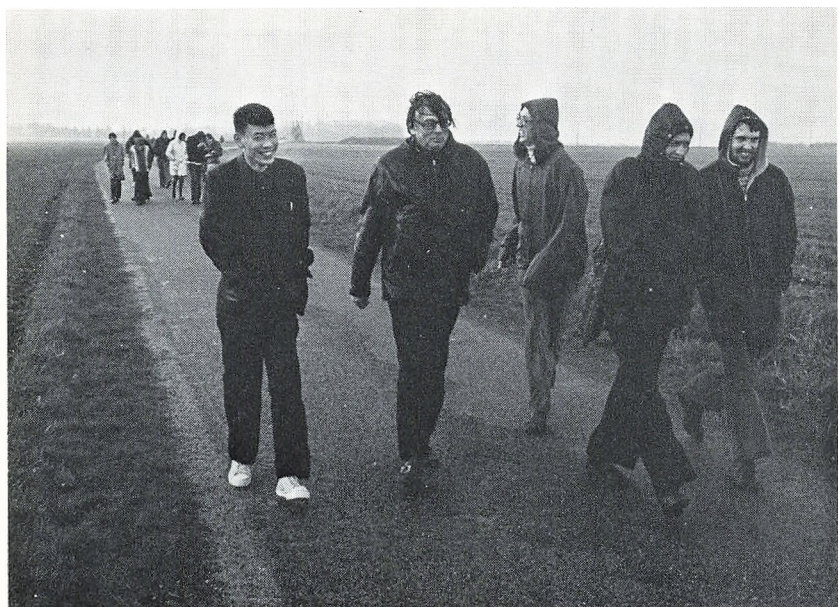
Sommerskolens start: Trævetur i piskregn.