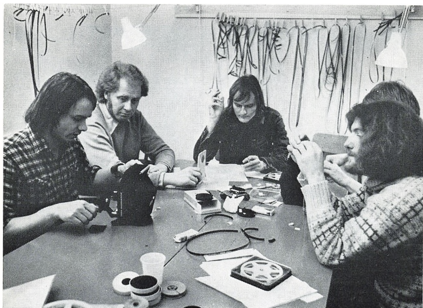
Uld-filmen redigeres. (Vinterskolen).