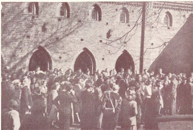
Vintereleverne synger for Klosterdamerne, April 48.