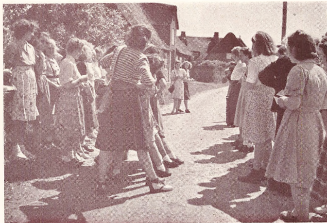
I Rudbøl. Grænsen markeres.