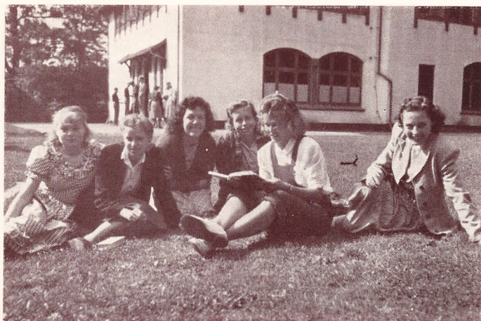
«En yndig og frydefuld Sommerdag...»