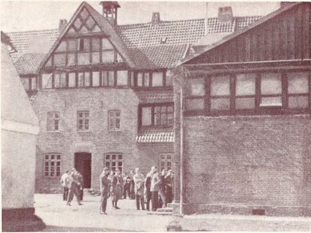
Skolegården i Solskin.