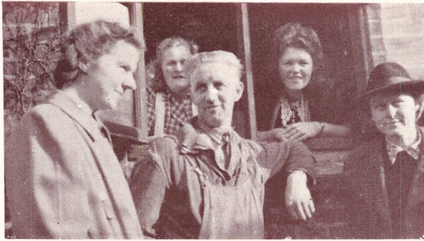
«De uundværlige» drofter Sagerne.