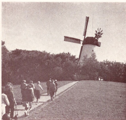
Morgenturen paa Dybbøl.