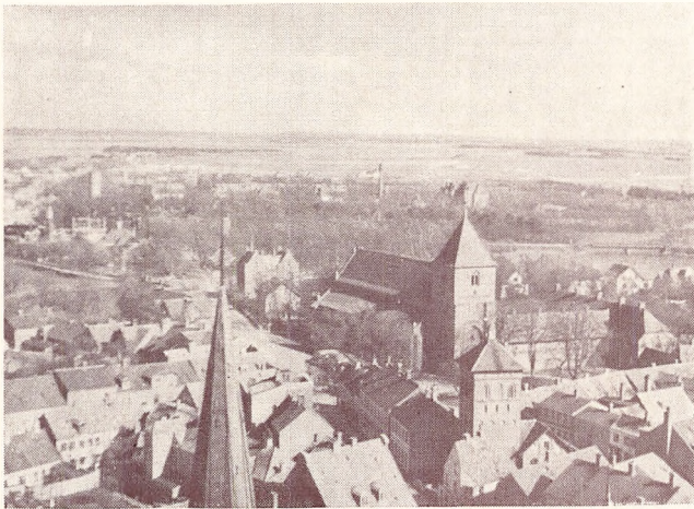
og over Byen.