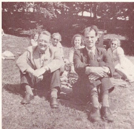
Middagsrast paa Banken.